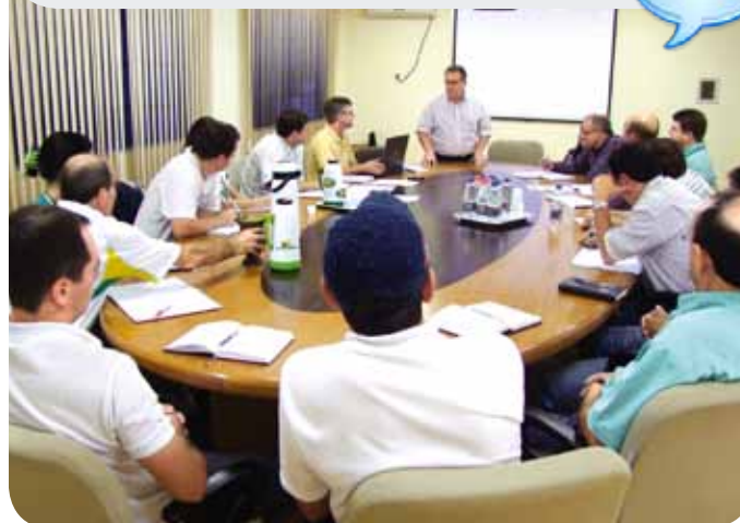
Presidente da Copercampos esteve participando da abertura do encontro

D urante o dia 25 de março, os chefes das unidades da Copercampos estiveram reunidos para debater o andamento dos trabalhos nas filiais e setores da cooperativa.