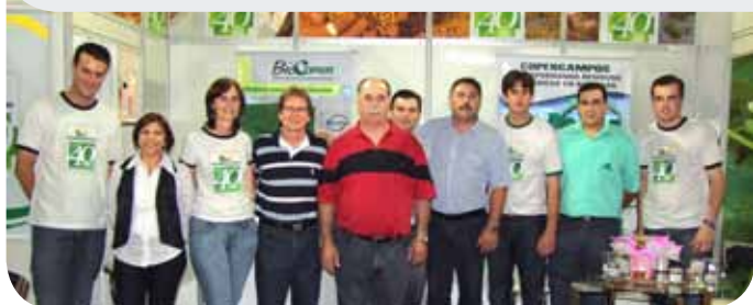
Funcionários da Copercampos, acompanhados do Prefeito Municipal de Campos Novos Vilbaldo Erich Schmid, vice-prefeito Jairo Luft e Deputado Estadual Romildo Titon na Festa de 129 de Campos Novos

D urante estes meses de março, abril e maio, a Copercampos estará participando de várias exposições em toda a região de abrangência da Copercampos.