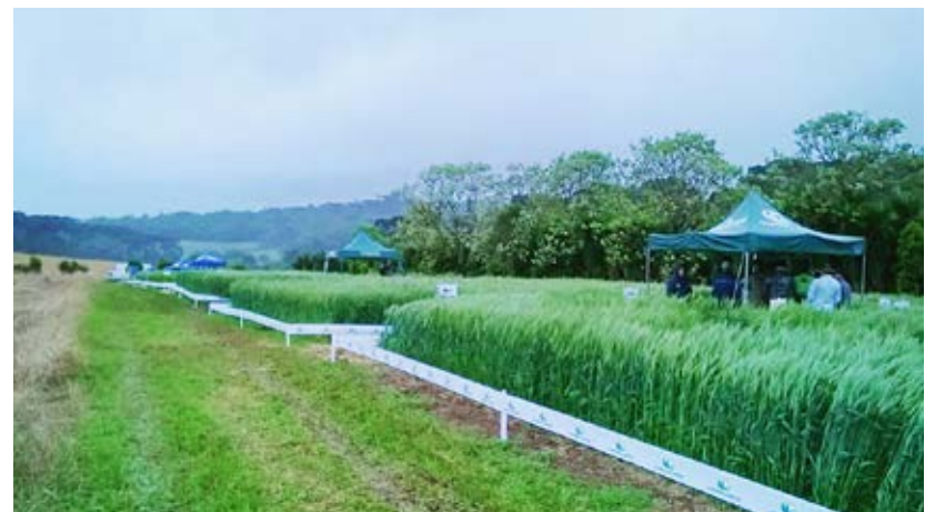
Evento realizado dia 28 de outubro em São José do Ouro/RS