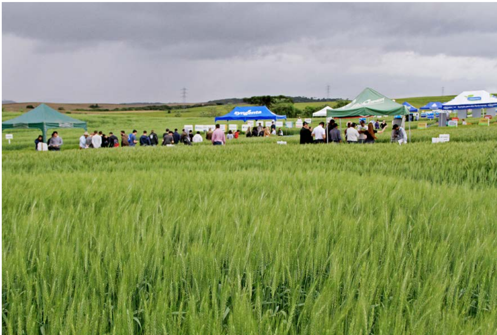
Evento atendeu expectativa dos organizadores

Com a participação de produtores associados, pesquisadores e público em geral, foi realizado no dia 26 de outubro o Dia de Campo Copercampos-Culturas de Inverno.