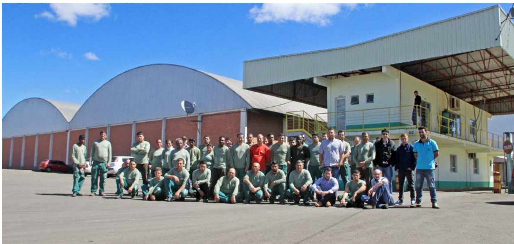
Equipe da UBS – Bairro Aparecida

As tecnologias disponíveis são fundamentais para obter sementes de alta qualidade e estão relacionadas com diversos fatores, como o manuseio das sementes, secagem, classificação, esfriamento dinâmico e logística do ensaque.