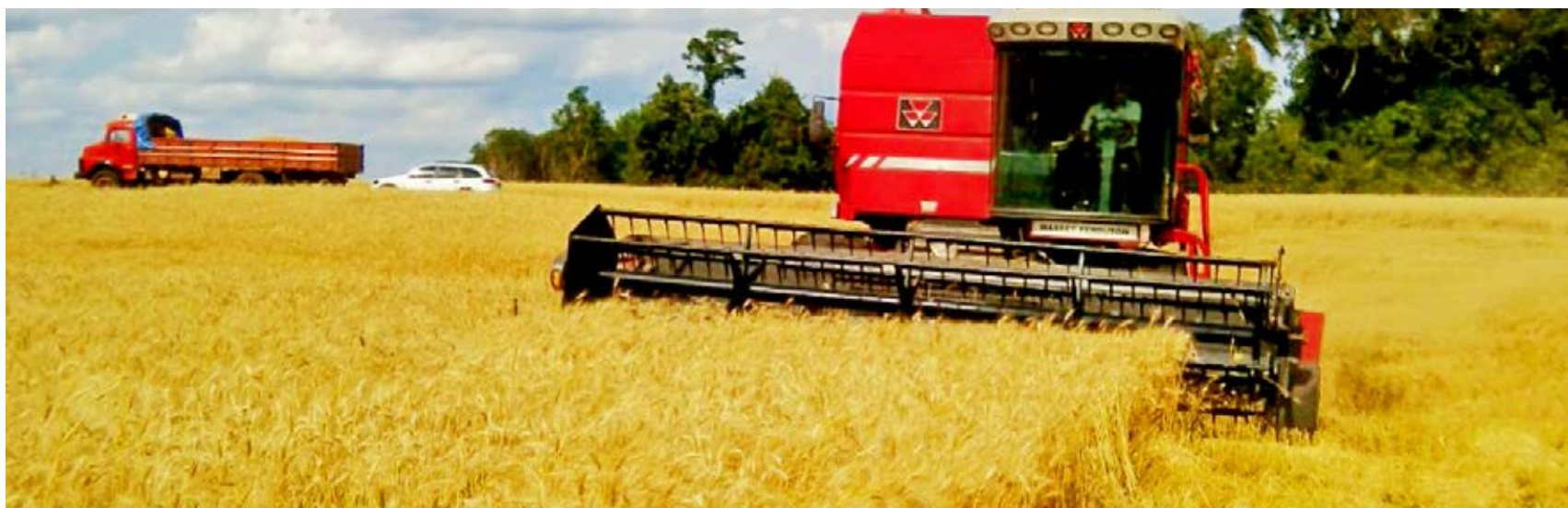
Colheita de trigo em andamento no município de Zortéa

Produtores rurais associados da Copercampos da região de Zortéa iniciaram, na primeira semana de novembro a colheita do trigo. Ao contrário da safra passada, o cultivo de inverno apresenta excelente qualidade.