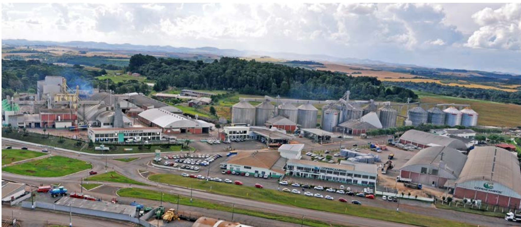
Matriz Copercampos em Campos Novos/SC

A Copercampos completa 46 anos de sucesso, solidez e credibilidade nas regiões onde atua. Fundada em 08 de novembro de 1970, mantém seu foco no desenvolvimento aonde está inserida e com produtos e serviços de credibilidade a cooperativa possui 50 unidades distribuídas nos estados de Santa Catarina e Rio Grande do Sul.