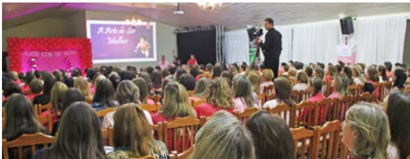
Evento fez parte da programação do Outubro Rosa

A Rede Feminina de Combate ao Câncer de Campos Novos com apoio do SESCOOP, realizou no dia 19 de outubro a Noite Cor-de-Rosa. Cerca de 220 pessoas participaram do evento que foi realizado na Associação Atlética da Copercampos em Campos Novos.