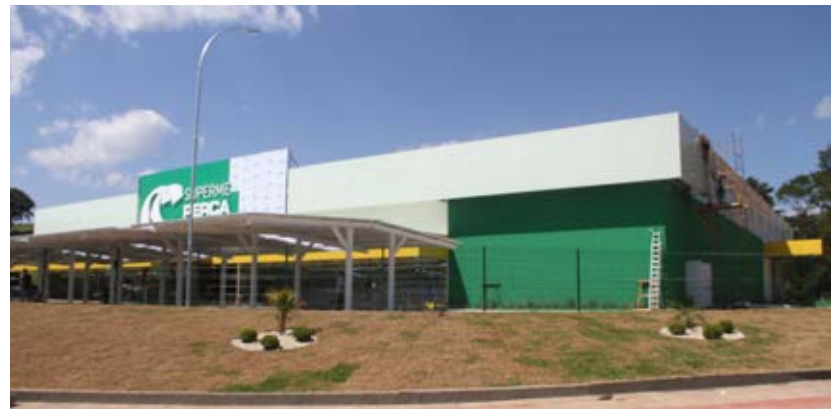
Supermercado Copercampos em Capinzal

Seguindo com seu cronograma de investimentos para 2016 a Copercampos iniciou as obras de construção de uma nova e moderna granja de suínos no município de Santa Cecília com capacidade de 1.500 matrizes em parceria com a Agrocere PIC, o que proporciona a produção de animais com genética de altíssima qualidade. A produção de suínos da Copercampos conta com sistema de rastreabilidade dos animais, pelo qual é possível acompanhar todo o processo, desde a criação até o mercado consumidor. Os suínos rastreados também são exportados para países da Ásia, como China, Japão e Rússia.