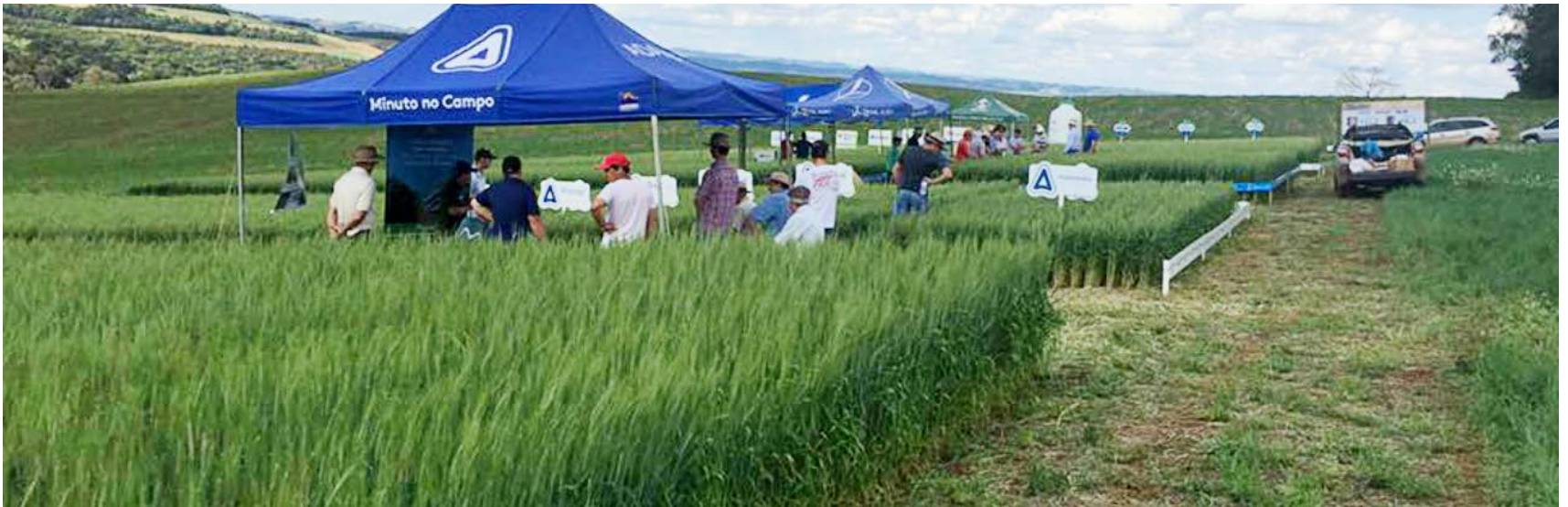
Evento realizado em Sananduva/RS no dia 14 de outubro

Produtores rurais da região de Sananduva, Lagoa Vermelha e São José do Ouro participaram nos dias 14, 21 e 28 de outubro do Dia de Campo Culturas de Inverno.