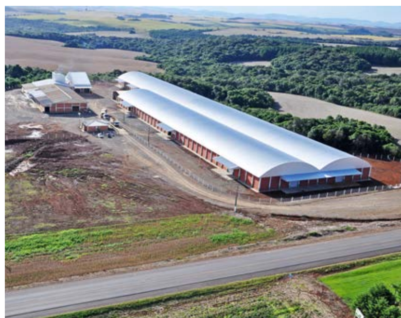
UBS localizada às margens da BR-470 em Campos Novos

Com os padrões de qualidade da cooperativa, além de amplo espaço adaptado para melhor atender os clientes e associados a Copercampos inaugurou em 2016 três novas Lojas. Localizadas nos municípios de Zortéa em Santa Catarina e nas cidades de Lagoa Vermelha e Sananduva no Rio Grande do Sul, as lojas contam com variedades de produtos, suporte em insumos e produtos para todas as atividades agropecuárias, além de material de construção.