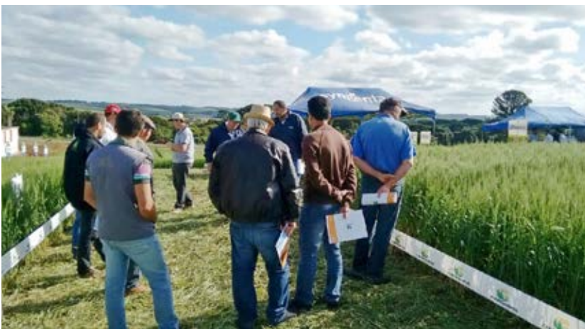
Tarde de Campo realizada em Lagoa Vermelha/RS no dia 21 de outubro

Em Lagoa Vermelha e Sananduva os eventos foram realizados nas áreas experimentais localizadas junto a unidades de armazenagem da Copercampos. Já em São José do Ouro, a tarde de Campo foi realizada na experimental próxima ao Pesque e Pague Tia Helena.