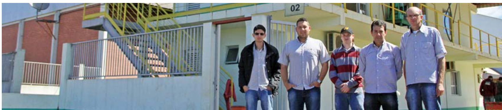
Funcionários Escritório/ Balança