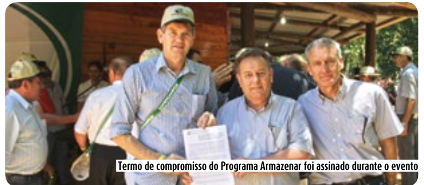
Termo de compromisso do Programa Armazenar foi assinado durante o evento