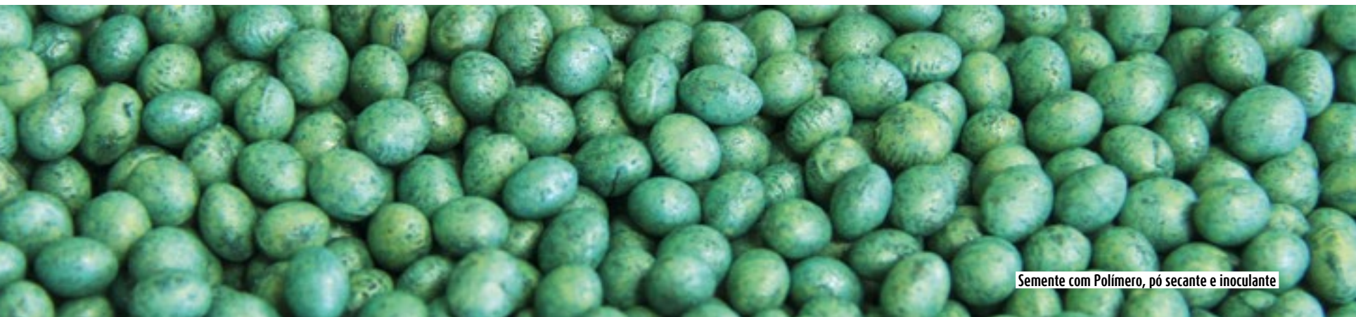
Semente com Polímero, pó secante e inoculante