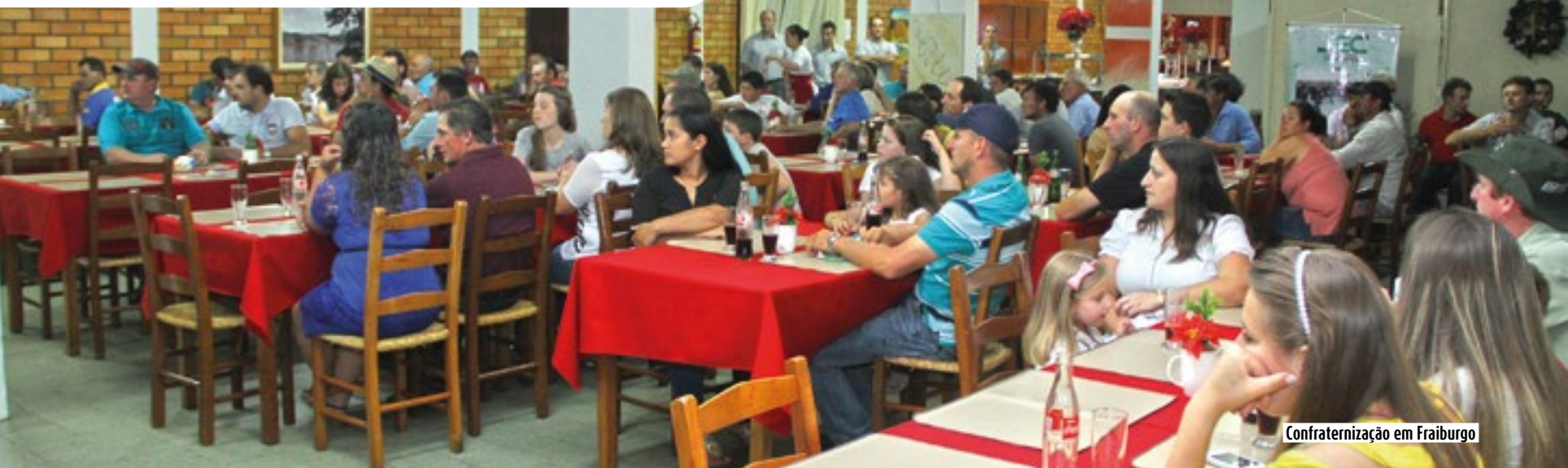
Confraternização em Fraiburgo

A Copercampos realizou entre fim do mês de novembro e o início de dezembro quatro encontros de confraternização com associados nas filiais de Anita Garibaldi, Bom Retiro, Celso Ramos e Fraiburgo. Os eventos marcaram a união entre a cooperativa e os mais 380 produtores associados nestes municípios.