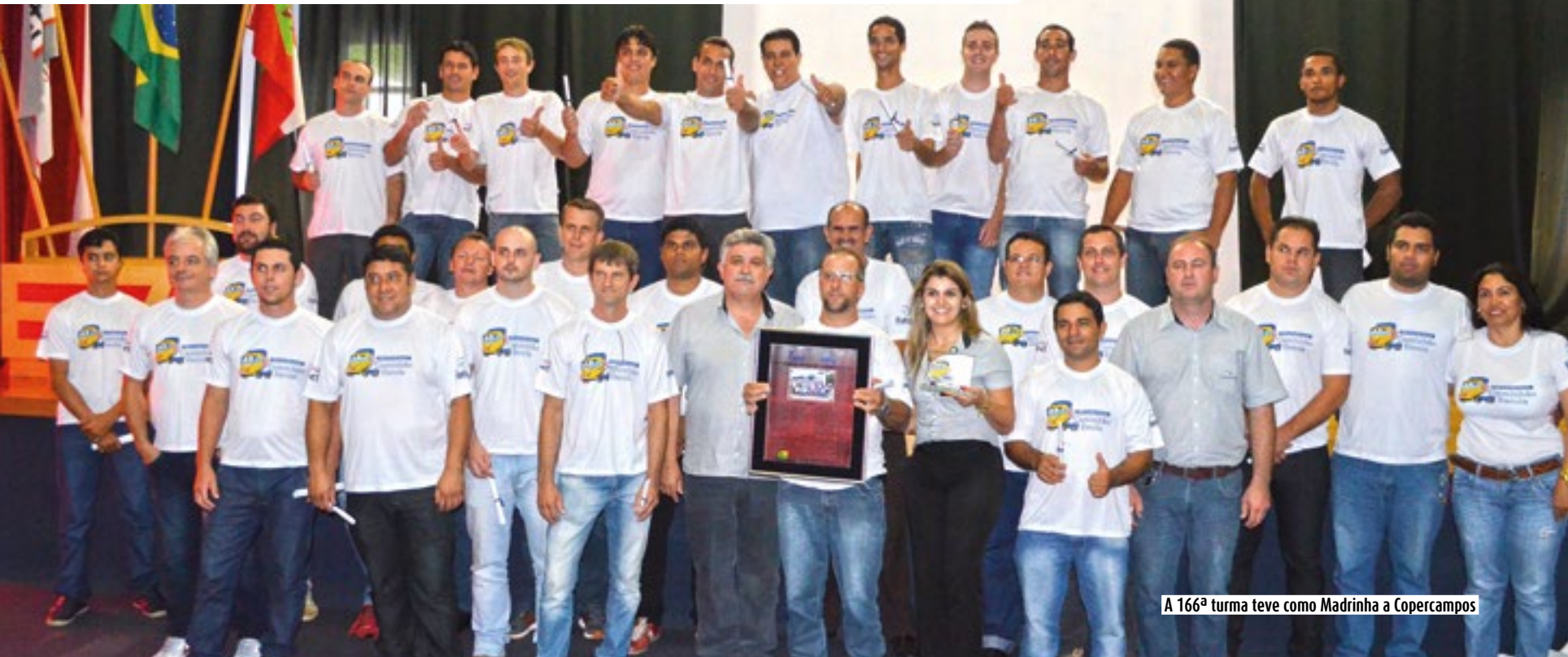
A 166ª turma teve como Madrinha a Copercampos

O Programa Caminhão Escola Básico da Fundação Adolpho Bósio de Educação no Transporte, (Fabet) que tem por objetivo preparar motoristas de caminhão iniciantes e sem experiência para o mercado de trabalho, chegou à sua turma de número 166. A formatura da turma, que contou com a participação de 30 alunos de todo o Brasil -, foi realizada no dia 24 de novembro no Auditório da Fabet em Concórdia (SC).