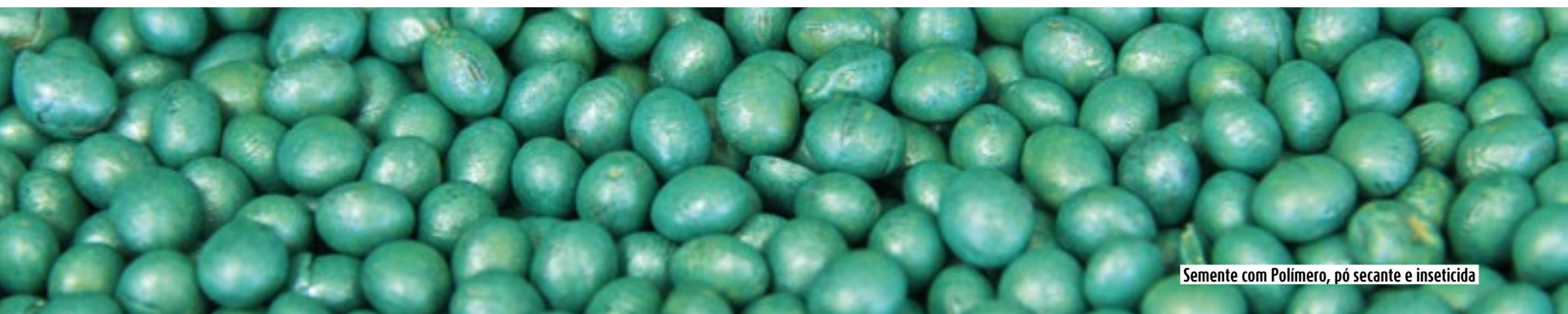
Semente com Polímero, pó secante e inseticida

A fixação biológica de nitrogênio atmosférico na cultura da soja é a principal fonte de nitrogênio para a cultura da soja. Para a produção de 3.000 toneladas/ha de grãos a soja demanda aproximadamente 240 kg de Nitrogênio por hectare. Se os produtores tivessem que aplicar esta quantidade de nutriente através de fontes minerais, inviabilizaria economicamente a cultura da soja.