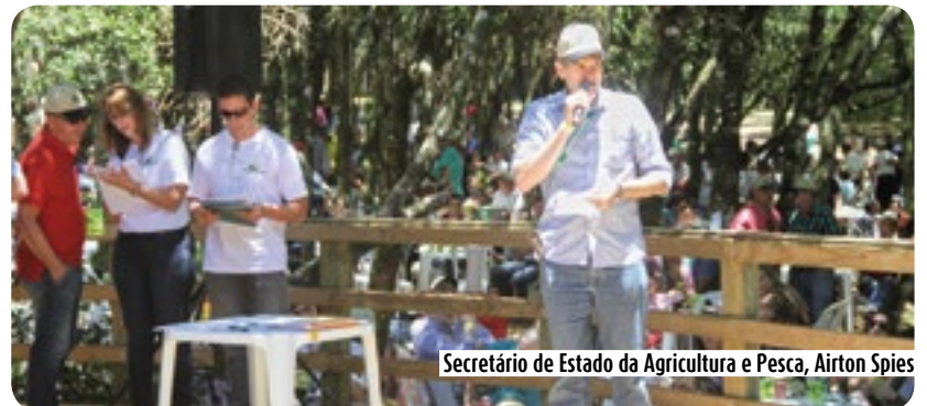
Secretário de Estado da Agricultura e Pesca, Airon Spies