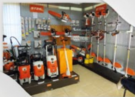
Linha completa de produtos Stihl