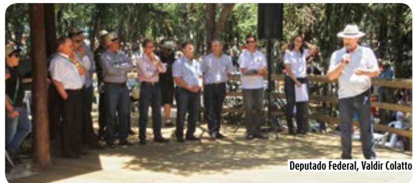
Deputado Federal, Valdir Colatto