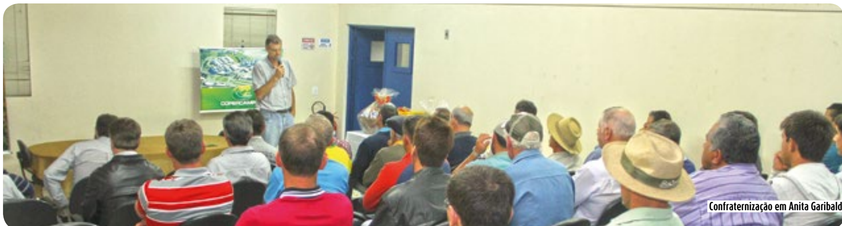
Confraternização em Anita Garibaldi