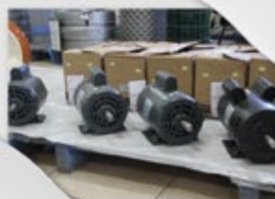
Motores Monofásicos 2 Polos Motores Monofásicos 4 Polos ¾ CV ½ CV 1 CV 2 CV e 3CV

Lona para vedação de Silo de 150 e 200 micras pelos menores preços E ainda: Inoculantes para silagem Bio Max Milho em oferta!