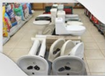
Toda linha de louças e metais sanitários Deca e Eternit

AS LOJAS AGROPECUÁRIAS COPERCAMPOS TEM A SUA DISPOSIÇÃO: