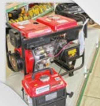
Gerador, Soldador e Compressor de ar