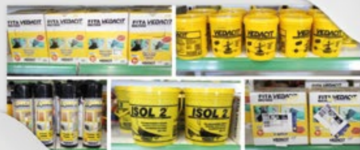
Vedação para paredes e telhados

Para consulta de preços e prazos, visite uma de nossas lojas e confira todos estes produtos e muitos outros.