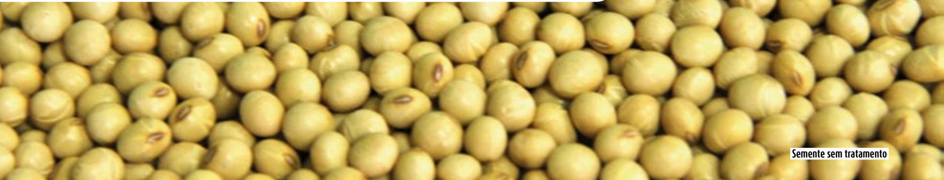
Semente sem tratamento