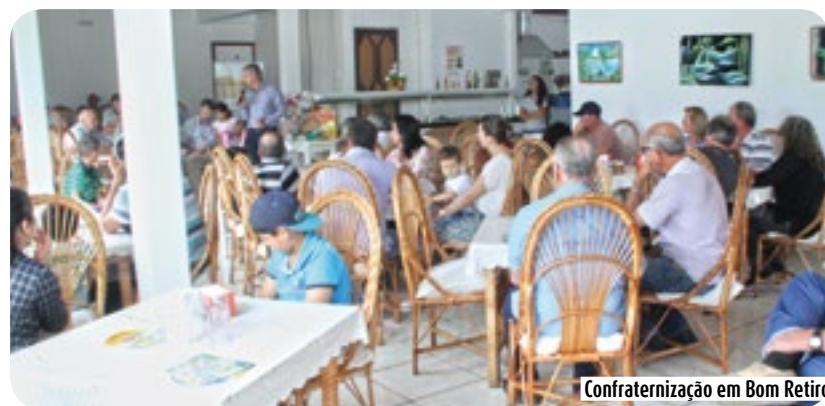
Confraternização em Bom Retiro