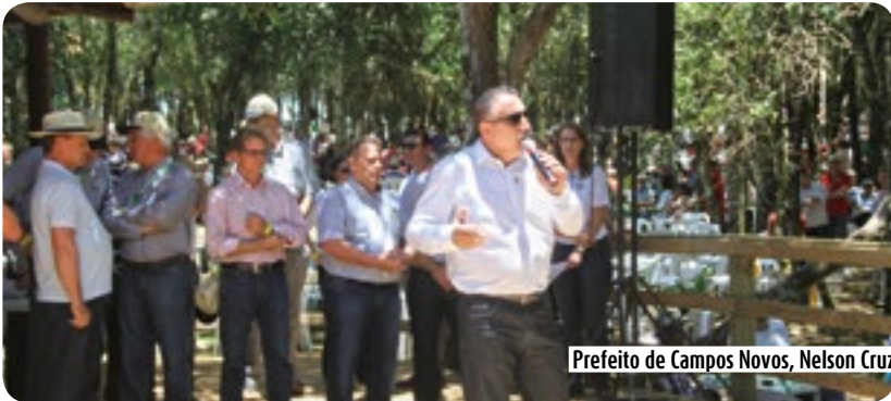
Prefeito de Campos Novos, Nelson Cruz