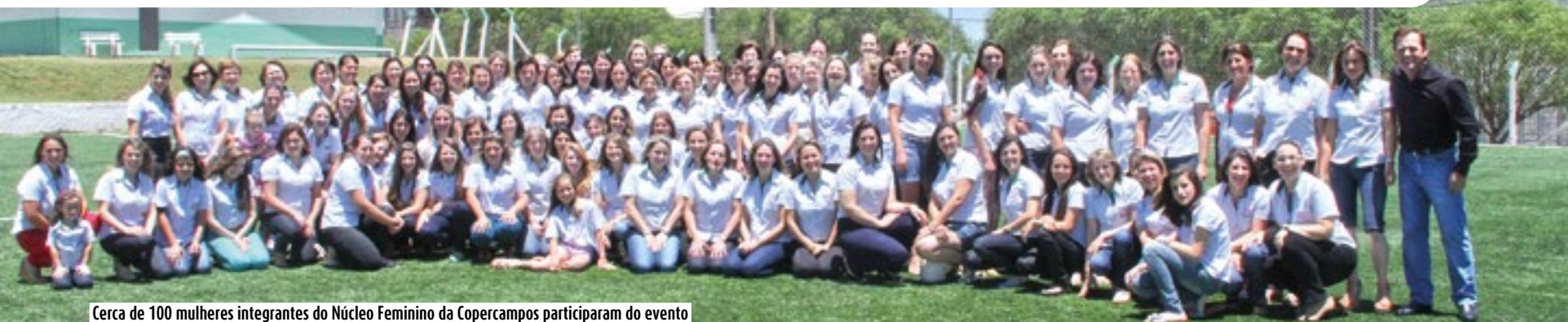
Cerca de 100 mulheres integrantes do Núcleo Feminino da Copercampos participaram do evento

União, respeito e paixão pelo trabalho no campo. Na Copercampos as mulheres estão presentes no cotidiano da cooperativa e lutam pelo desenvolvimento em suas propriedades e pelo sucesso do setor do agronegócio. Para celebrar as ações desenvolvidas durante o ano 2014, cerca de cem mulheres integrantes do Núcleo Feminino da Copercampos participaram no sábado, 29 de novembro, das atividades de encerramento que ocorreram na Associação Atlética da Cooperativa (AACC).