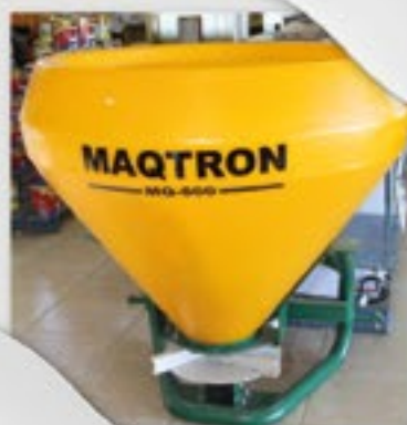
Distribuidor de Sementes e Insumos. Capacidade 600kg