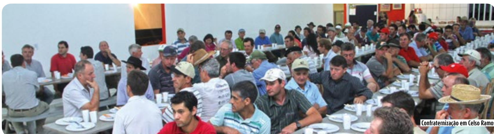
Confraternização em Celso Ramos