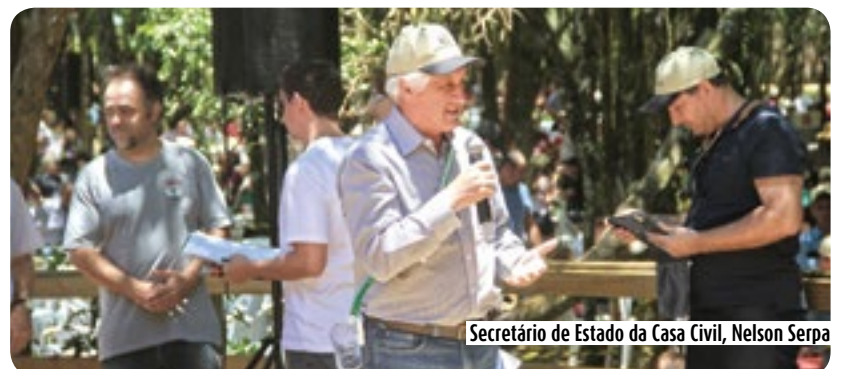
Secretário de Estado da Casa Civil, Nelson Serpa