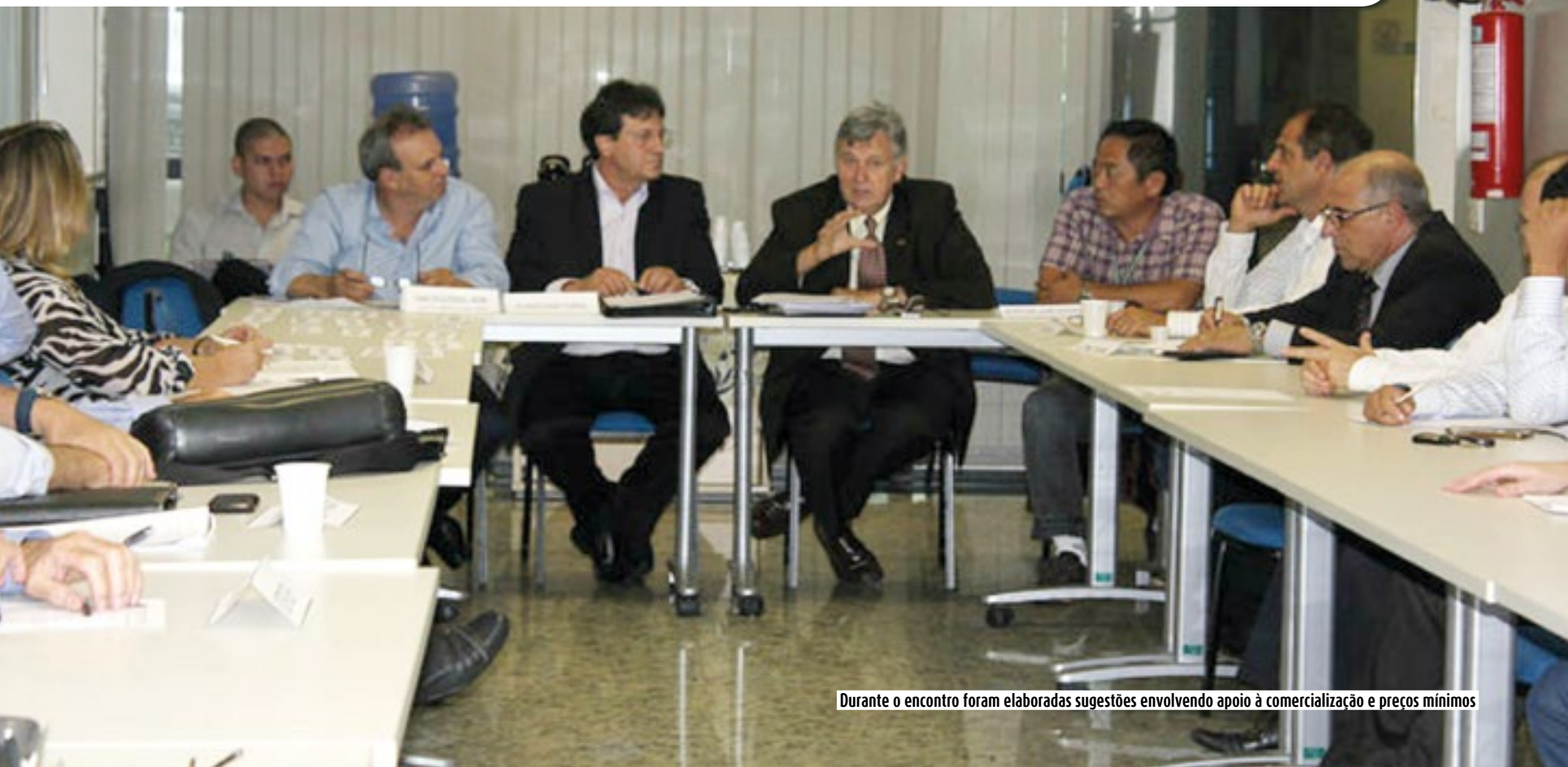
Durante o encontro foram elaboradas sugestões envolvendo apoio à comercialização e preços mínimos