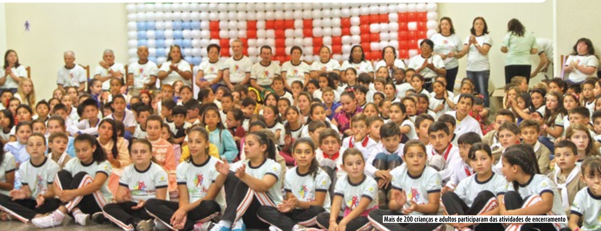
Mais de 200 crianças e adultos participaram das atividades de encerramento

Com o objetivo de despertar nas crianças, habilidades em diversas áreas e formar assim, jovens comprometidos e conscientes com sua saúde, educação, amizade e união, princípios do cooperativismo, a Copercampos, em parceria Prefeitura Municipal de Campos Novos, através da Secretaria de Educação e Cultura apoia diversos projetos sociais em Campos Novos e para celebrar as ações e conquistas do ano 2014 promoveu o V Encontro do projeto “Alegria de Viver – Revelando Talentos”.