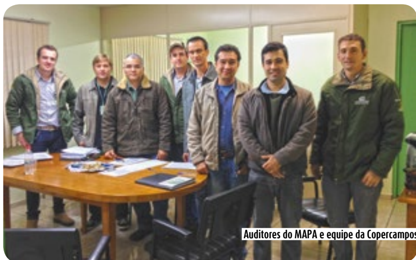
Audidores do MAPA e equipe da Copercampos