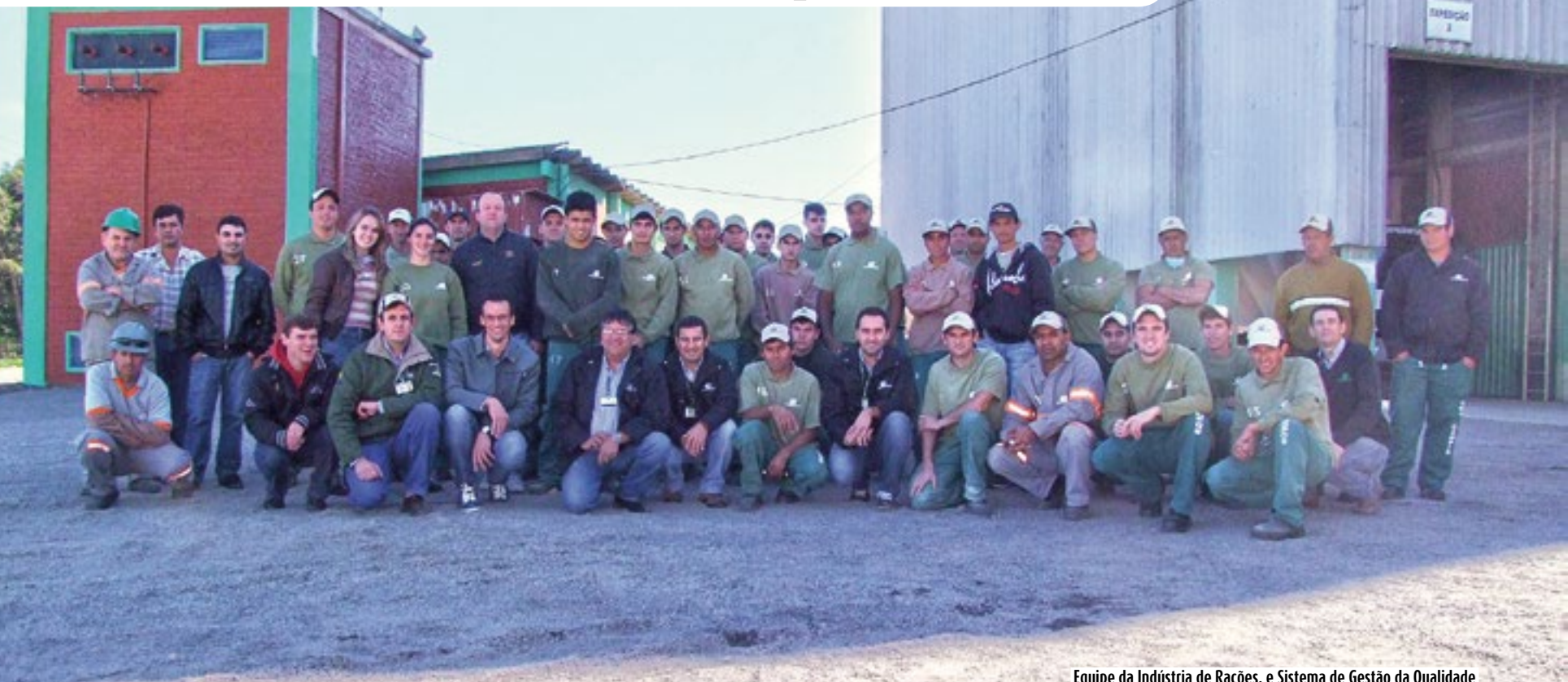
Equipe da Indústria de Rações, e Sistema de Gestão da Qualidade

A Indústria de Rações da Copercampos participou nos dias 27, 28 e 29 da auditoria realizada pelo Ministério da Agricultura Pecuária e Abastecimento – MAPA. A auditoria foi conduzida por 4 Fiscais Federais Agropecuários, que durante estes três dias avaliaram 153 itens do check list da Instrução Normativa nº 04, no que se refere às Boas Práticas de Fabricação (BPF), assim como a avaliação de todo o processo para evitar a contaminação cruzada das rações, com relação a Instrução Normativa nº 65, que refere-se a produção de rações com medicamentos veterinários. E também todos os processos para certificação da Planta Livre de ractopamina.