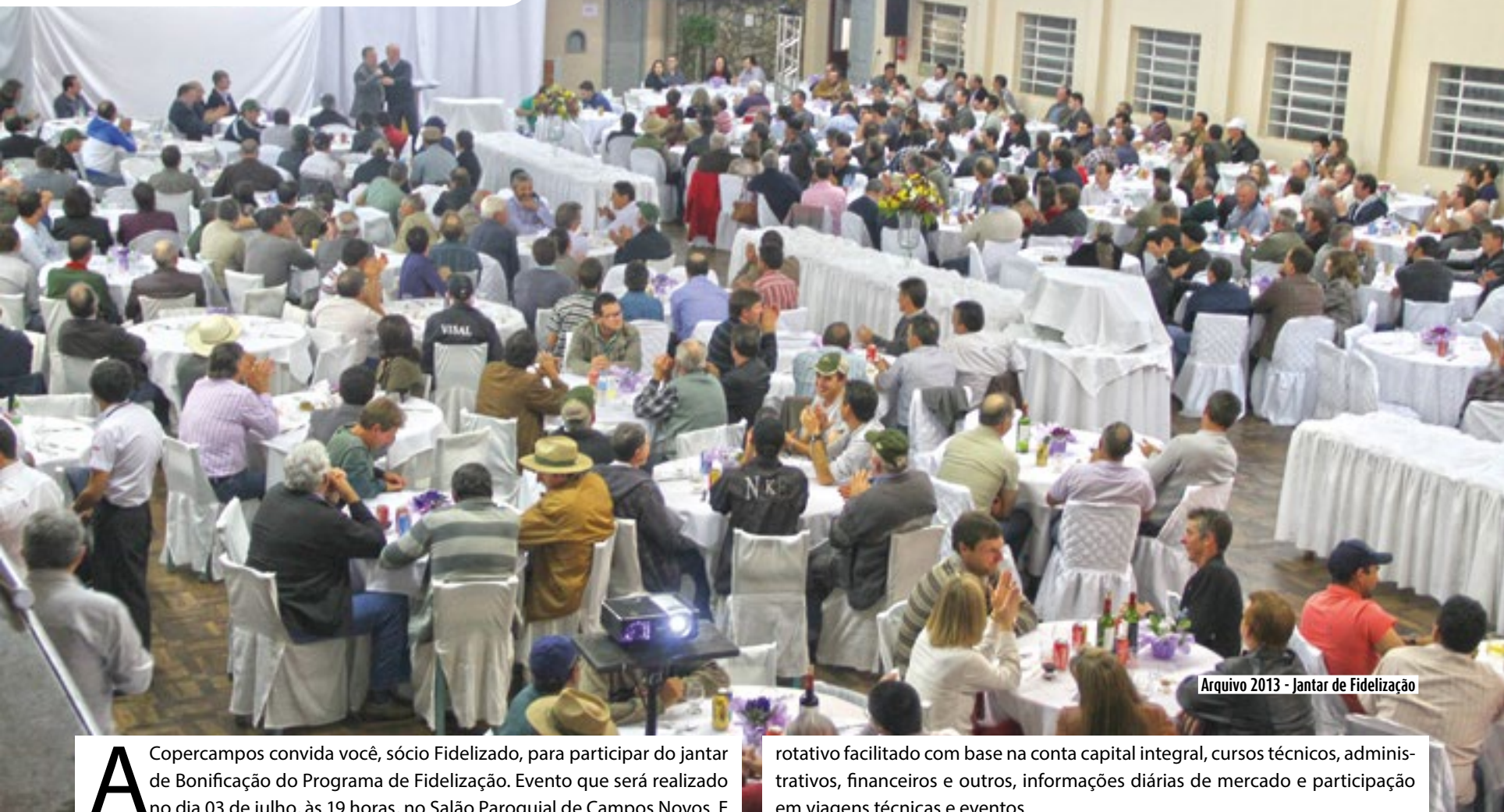
Arquivo 2013 - Jantar de Fidelização

A Copercampos convida você, sócio Fidelizado, para participar do jantar de Bonificação do Programa de Fidelização. Evento que será realizado no dia 03 de julho, às 19 horas, no Salão Paroquial de Campos Novos. E para os associados que ainda não são fidelizados, conheçam como funciona o Programa e os benefícios de ser Sócio Fidelizado da Copercampos.