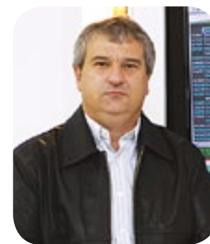
Por Paulo Molinari Analista de Mercado

O mercado de milho vai convergindo para uma variável de boas produções no Hemisfério Norte. Estados Unidos, Europa, Rússia, Ucrânia seguem com condições climáticas normais e, após, quatro anos de problemas sequentes, as expectativas retomam o otimismo com a produção de milho, soja e trigo. Os preços são inversamente proporcionais a produções elevadas e ao menos que o consumo surpreenda nos próximos meses, o mercado nestas três commodities sugere um ciclo de patamares mais baixos em nível mundial. Imaginar ou supor fatores de reversão para este quadro é natural, porém, enquanto não surgirem o mercado vai precificando a elevação da produção mundial e o reequilíbrio de preços. O caso brasileiro no milho parece mais grave, não em função da baixa externa, mas, pelo fato de atuarmos com a devida proporção de um exportador ao longo do ano. Expectativas, informações internas distorcidas, transferência de notícias sempre otimistas aos produtores geram ambientes que deformam o quadro real interno brasileiro e impede que as oportunidades de comercialização sejam melhor aproveitadas ao longo do ano comercial.