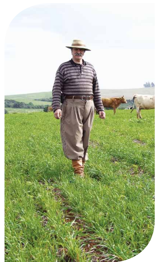
No inverno, gado de engorda é uma das fontes de renda do produtor