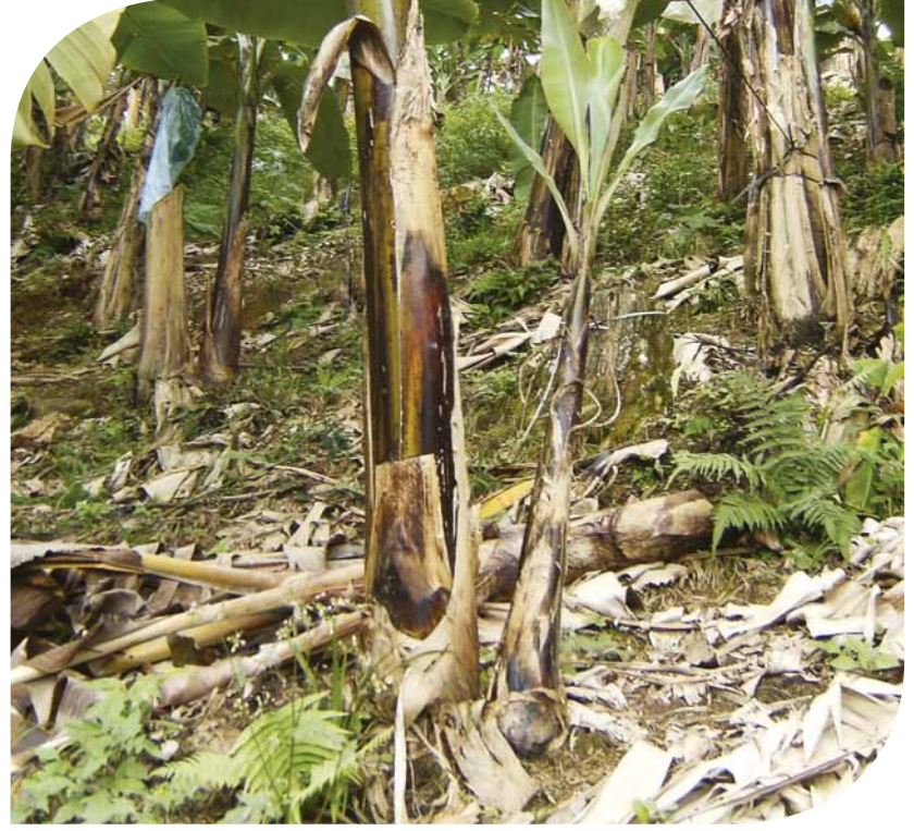
Broto com adubação convencional

Além da utilização em cereais como trigo, milho, feijão e soja, e dos hortifrutigranjeiros como beterraba, alho e cebola, produtores de Banana de Luiz Alves, no Vale do Itajaí – Santa Catarina, estão conferindo as potencialidades do fertilizante orgânico da Copercampos.