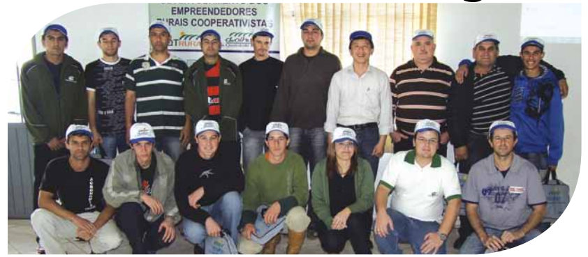
Participantes do DeOlho na Qualidade Rural de Campo Belo do Sul

P rodutores associados da Copercampos de Curitibaanos e de Campo Belo do Sul iniciaram nos dias 29 e 30 de julho, o Programa DeOlho na Qualidade Rural.