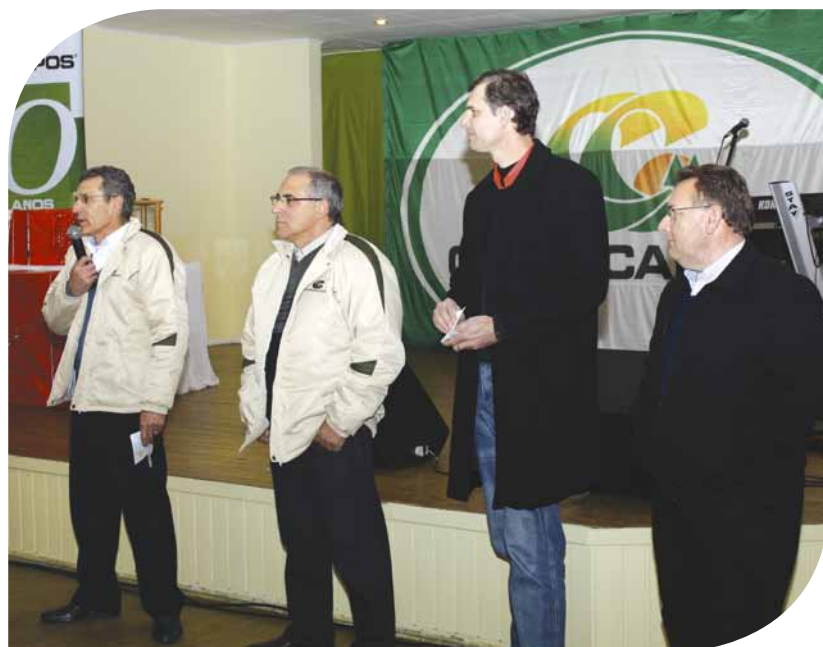
Diretores da Copercampos agradeceram a participação dos associados no Programa