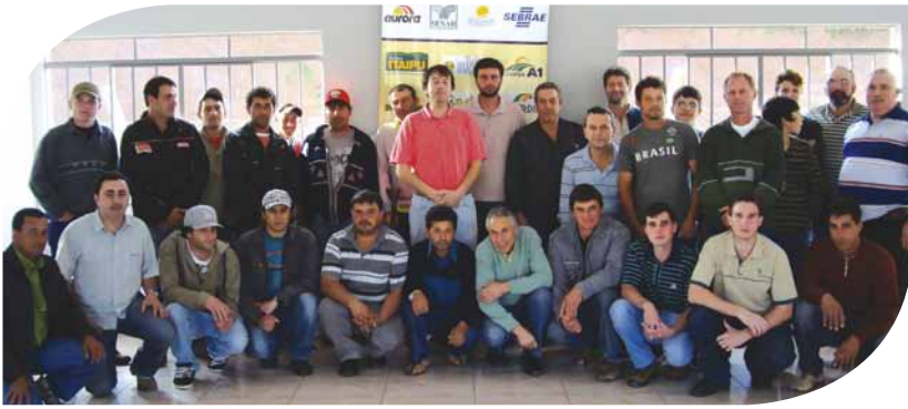
Produtores participantes do DeOlho de Curitibaanos