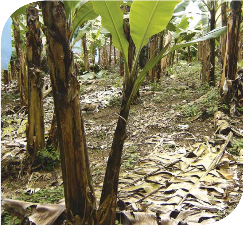
Broto de Banana com BioCoper