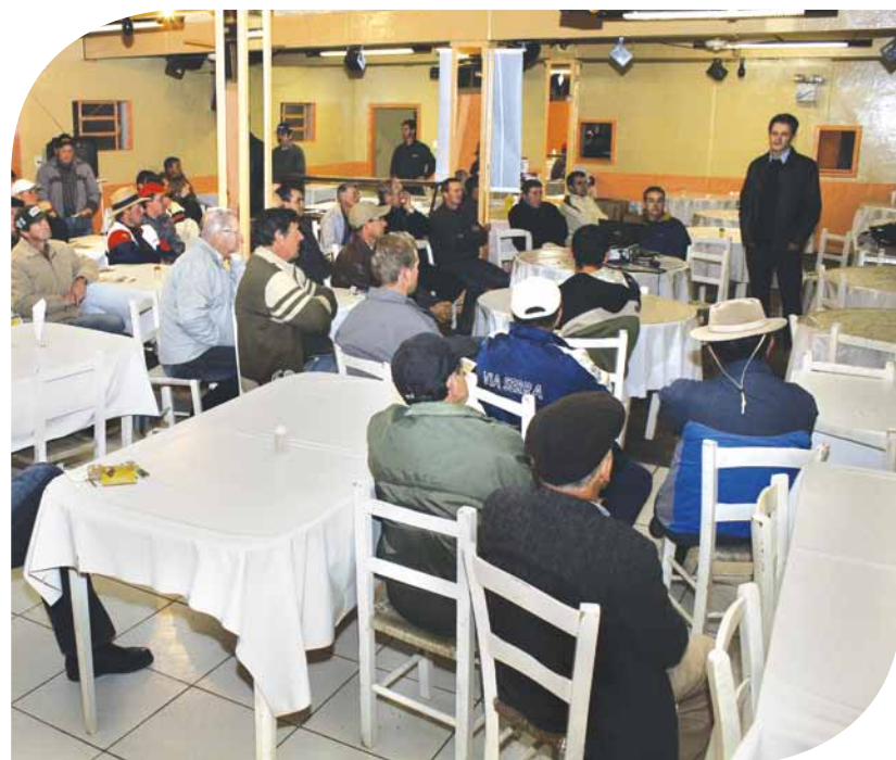
Encontro em Anita Garibaldi

Atenção, conhecimento e segurança para produzir. Produtores do município de Anita Garibaldi, Fraiburgo e Celso Ramos participaram de encontros com representantes da Copercampos, Syngenta e Associação de Revendas de Agrotóxicos da Região de Campos Novos (ARARCAM), onde puderam tirar dúvidas sobre como realizar a tríplex lavagem de embalagens, obter informações das empresas parceiras do projeto e de como realizar o trabalho da lavoura utilizando os Equipamentos de Proteção Individual (EPI).