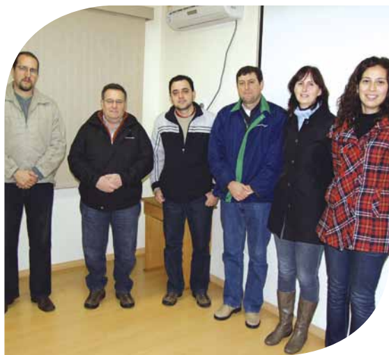
Representantes da BASF, Copercampos e Bellini Cultural

E ducação ambiental se faz com participação e conhecimento. A Copercampos, em parceria com a empresa BASF irá realizar do dia 25 de agosto a 03 de setembro, em Campos Novos, o projeto Mata Viva – Planeta Água, Um Mundo Sustentável.