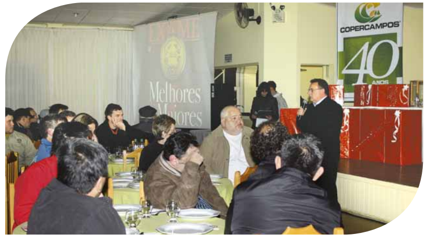
"O programa de fidelização é mais uma forma de estimular o produtor a participar ativamente do trabalho e crescimento da Copercampos", afirmou Chiocca