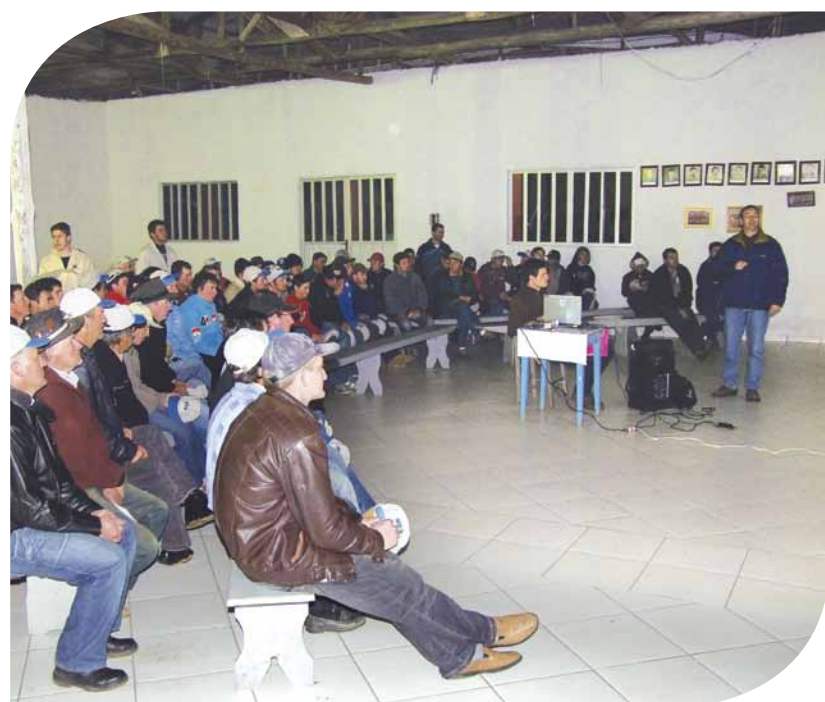
Mais de 70 produtores de Celso Ramos participaram da palestra