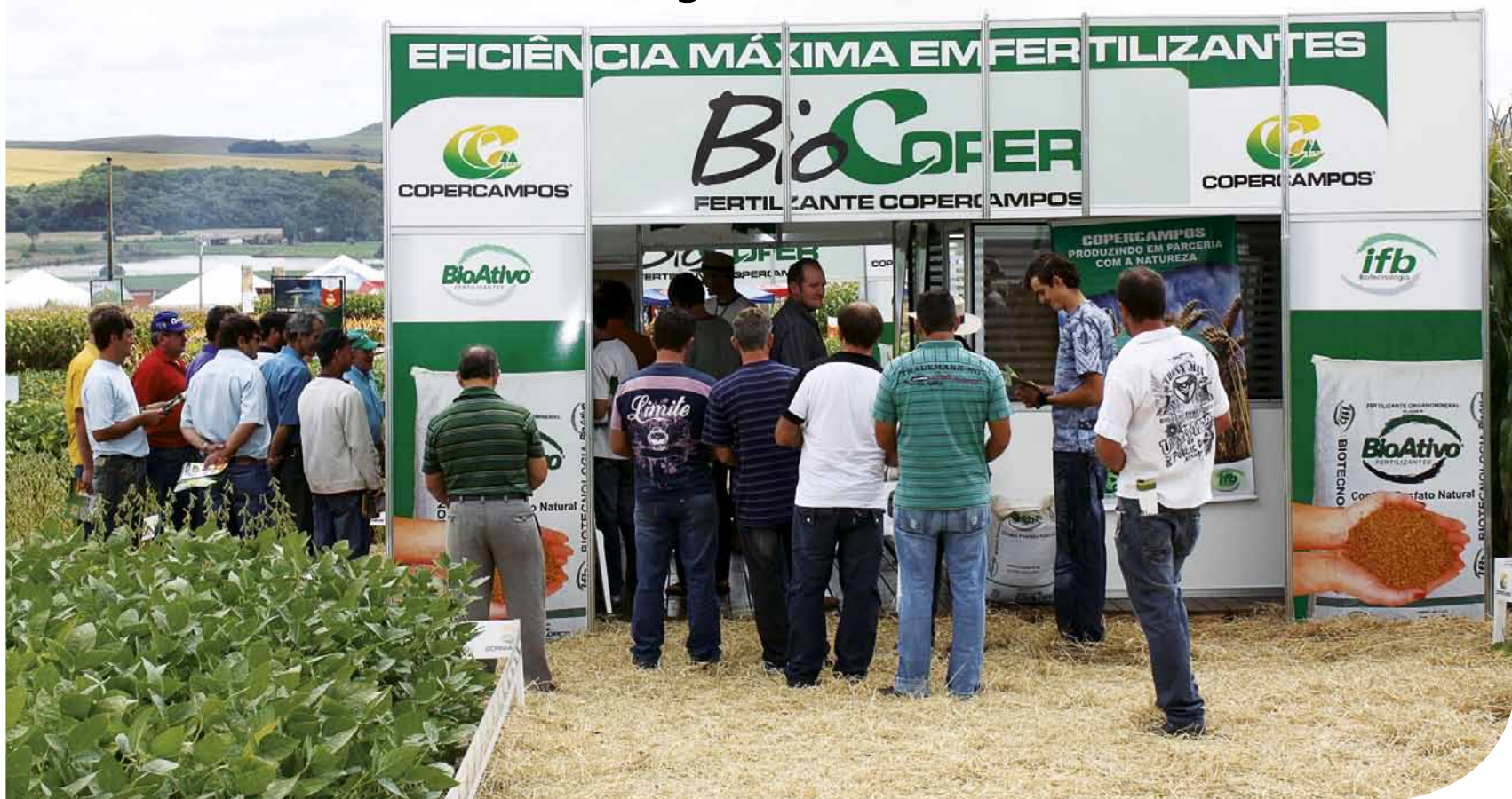
Dia de Campo 2010

A coordenação do 16º Dia de Campo Copercampos, evento referência do agronegócio Brasileiro, que acontecerá de 08 a 10 de março de 2011 em Campos Novos, já está realizando reuniões a fim de disponibilizar a melhor estrutura para atender os expositores e o público visitante.