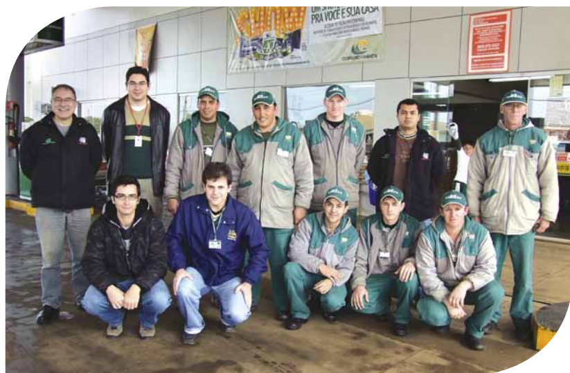
Funcionários do Posto de Combustíveis Copercampos e auditor da Bureau Verita (Petrobras)

Através do Desafio Petrobras, os profissionais do posto conquistam pontos que são ao final do ano, trocados por prêmios da Petrobras. Durante todo o treinamento, houve avaliação de vários segmentos e o Posto de Combustíveis Copercampos está a cada dia, na busca pelo melhor atendimento para satisfazer as necessidades de seus clientes.