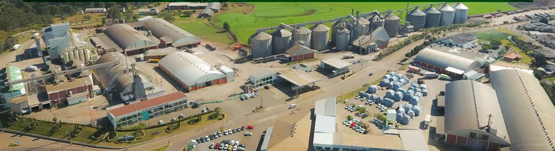
Vista aérea da matriz da cooperativa, em Campos Novos/SC

No dia 08 de novembro de 2018, a Cooperativa Regional Agropecuária de Campos Novos – Copercampos, comemorou 48 anos de fundação. A semente plantada pelos 100 primeiros associados em 1970, continua a produzir riquezas e proporciona o desenvolvimento sustentável da grande região de atuação da cooperativa. São mais de 65 unidades distribuídas pelo Meio-oeste, Planalto Serrano e Vale do Itajaí, em Santa Catarina, e nas mesorregiões Nordeste e Noroeste do Rio Grande do Sul.