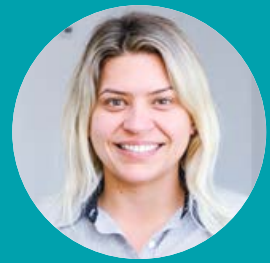
Por Bruna Alessandra Cruz Médica Veterinária Copercampos