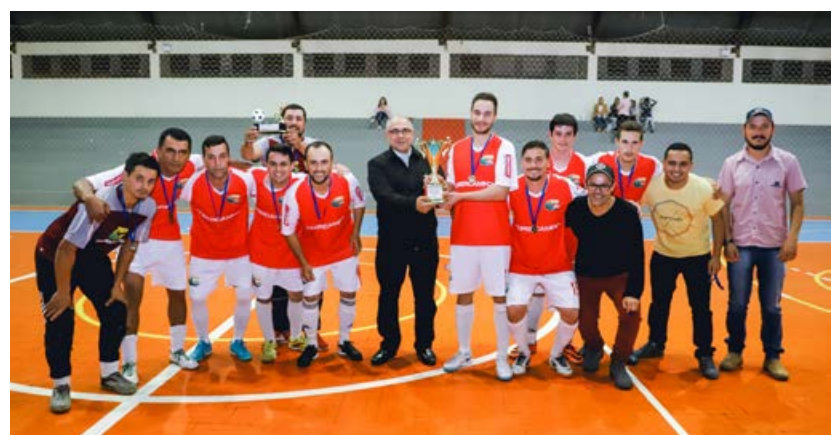
Campo Belo do Sul - Equipe campeã do campeonato de futsal