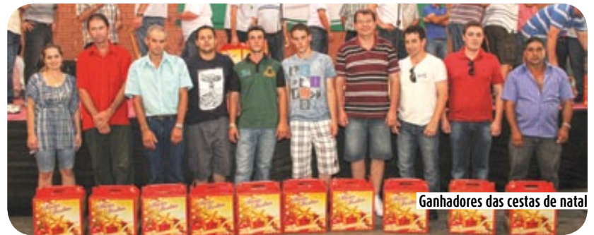
Ganhadores das cestas de natal