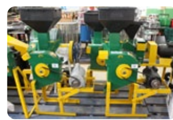
Toda linha de forrageiras Maqtron