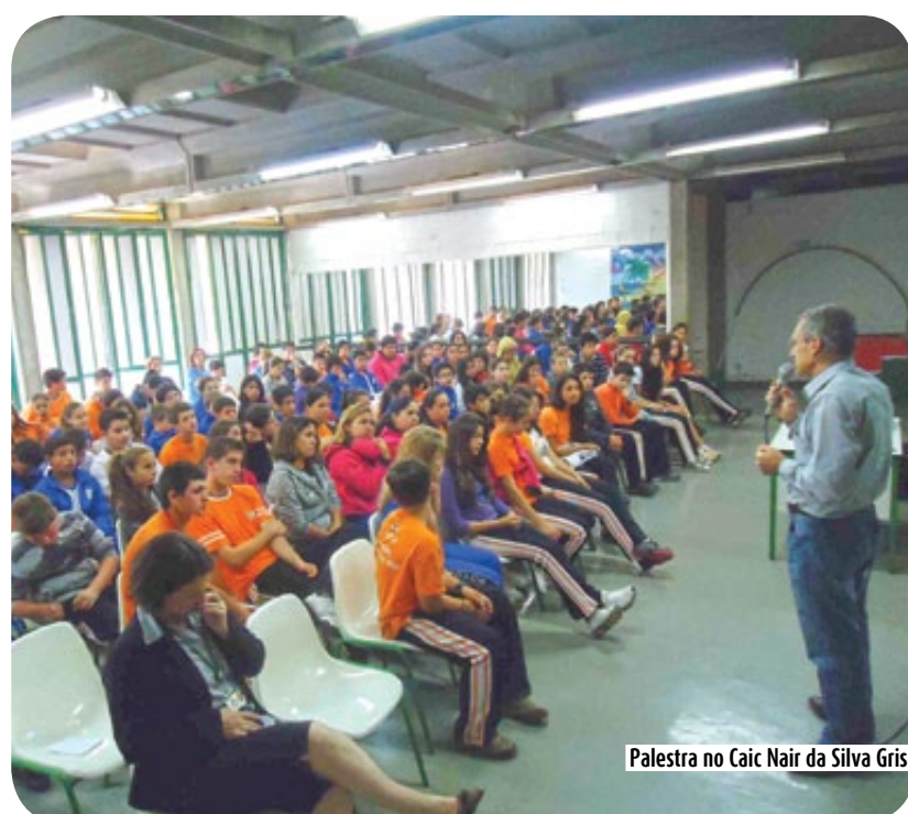
Palestra no Caic Nair da Silva Griss