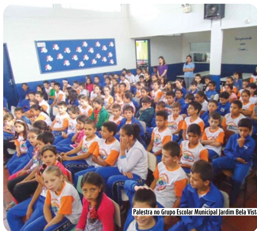
Palestra no Grupo Escolar Municipal Jardim Bela Vista