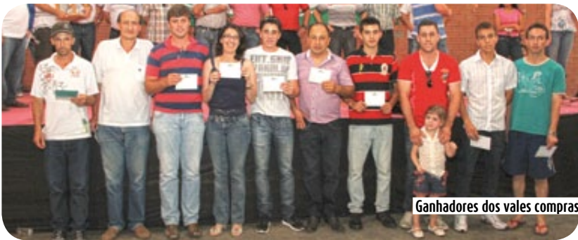
Ganhadores dos vales compras

Brinquedos também foram instalados para que as crianças pudessem se divertir na festa.