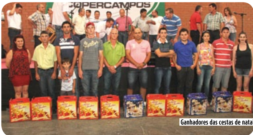
Ganhadores das cestas de natal