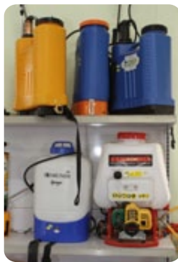
Pulverizadores costais a motor e manuais