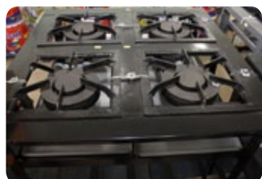
Discos e fogareiros em 3x sem juros