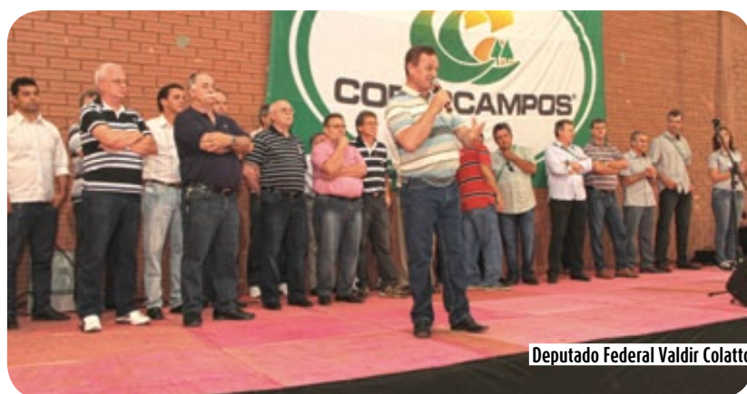
Deputado Federal Valdir Colatto