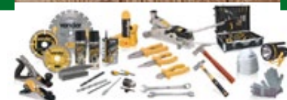
Toda linha de produtos Vonder Serra Tico-Tico; Macacos hidráulicos; Caixas de ferramentas e muito mais!