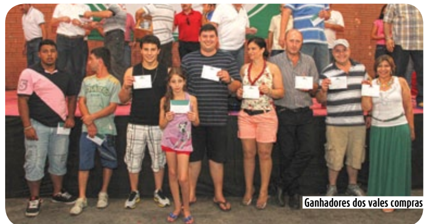
Ganhadores dos vales compras