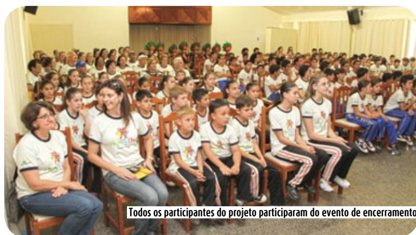
Todos os participantes do projeto participaram do evento de encerramento

O Prefeito Municipal de Campos Novos Vilivaldo Erich Schmid destacou a preocupação da Copercampos em desenvolver o espírito cooperativista nas crianças do município. “Ficamos felizes em participar dos projetos e contribuir com o desenvolvimento das crianças. A Copercampos está mais uma vez de parabéns por desenvolver todos estes projetos e o governo municipal será sempre apoiador de ações que promovem o crescimento social e educacional. Nós ficamos encantados em conferir nas apresentações ensinamentos que jamais serão esquecidos e de poder fazer parte destes projetos realizados pela Copercampos, Sescop/SC e Prefeitura Municipal”, destacou.