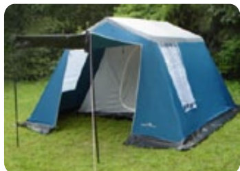
Vai acampar? Barracas Bangalô Náutica p/ 5 pessoas com preço especial!