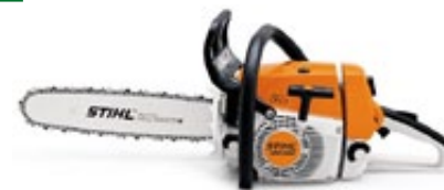
Motosserras Stihl em promoção!

Para consulta de preços e prazos visite nossa loja e confira todos estes produtos e muitos outros.