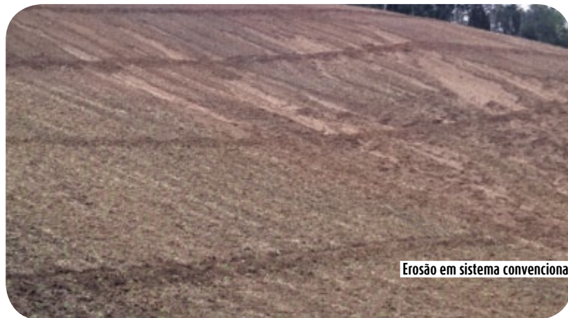
Erosão em sistema convencional