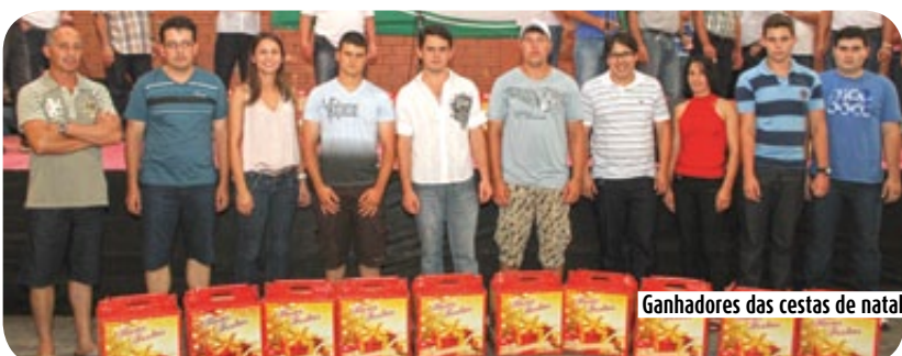
Ganhadores das cestas de natal