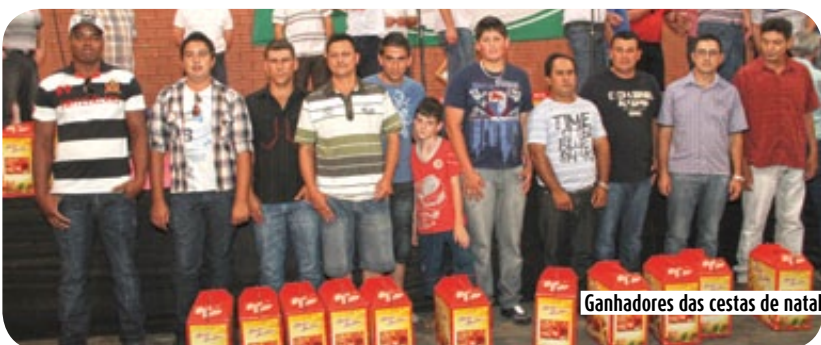
Ganhadores das cestas de natal