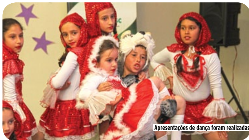
Apresentações de dança foram realizadas