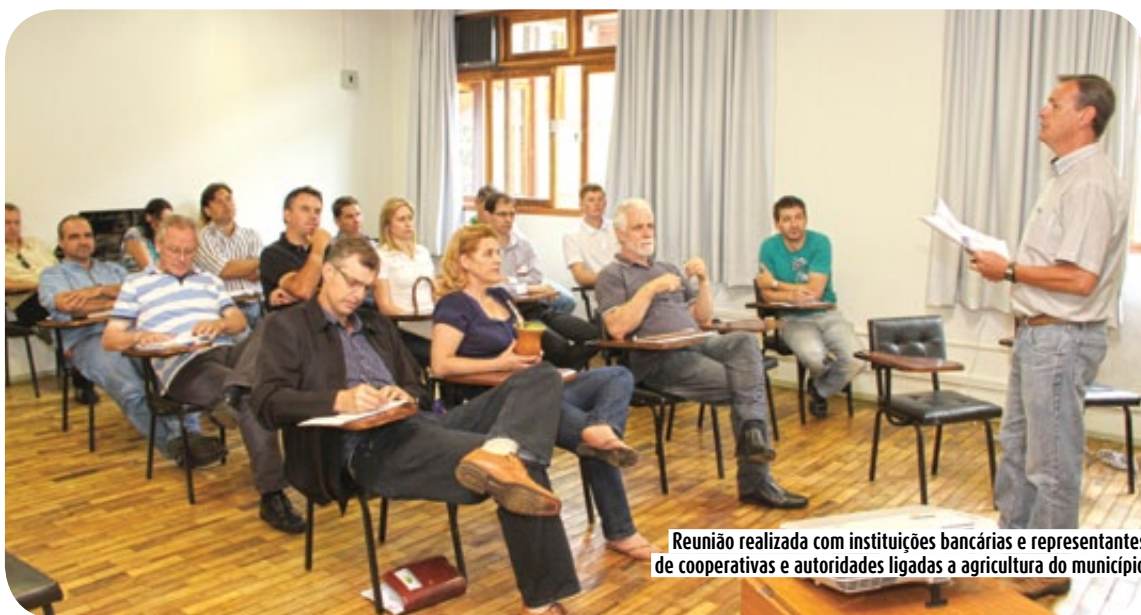
Reunião realizada com instituições bancárias e representantes de cooperativas e autoridades ligadas a agricultura do município