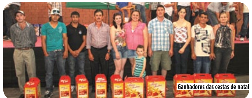
Ganhadores das cestas de natal