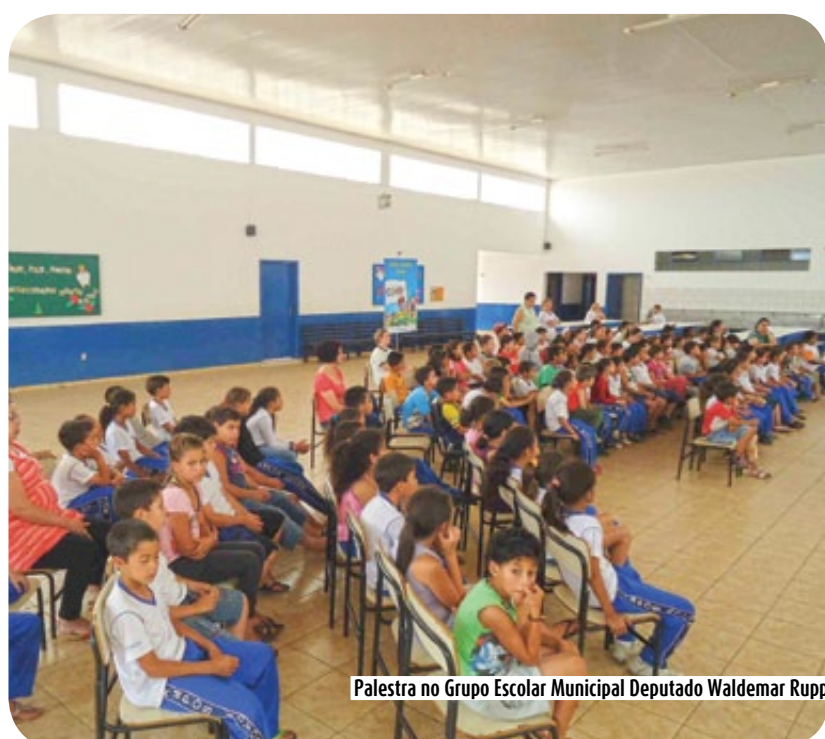
Palestra no Grupo Escolar Municipal Deputado Waldemar Rupp