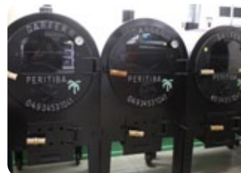
Fornos Darfer Peritiba Inox Tam: P/M/G