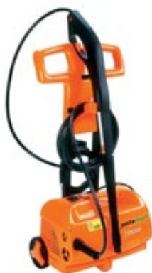
Diversas opções em Lava Jatos