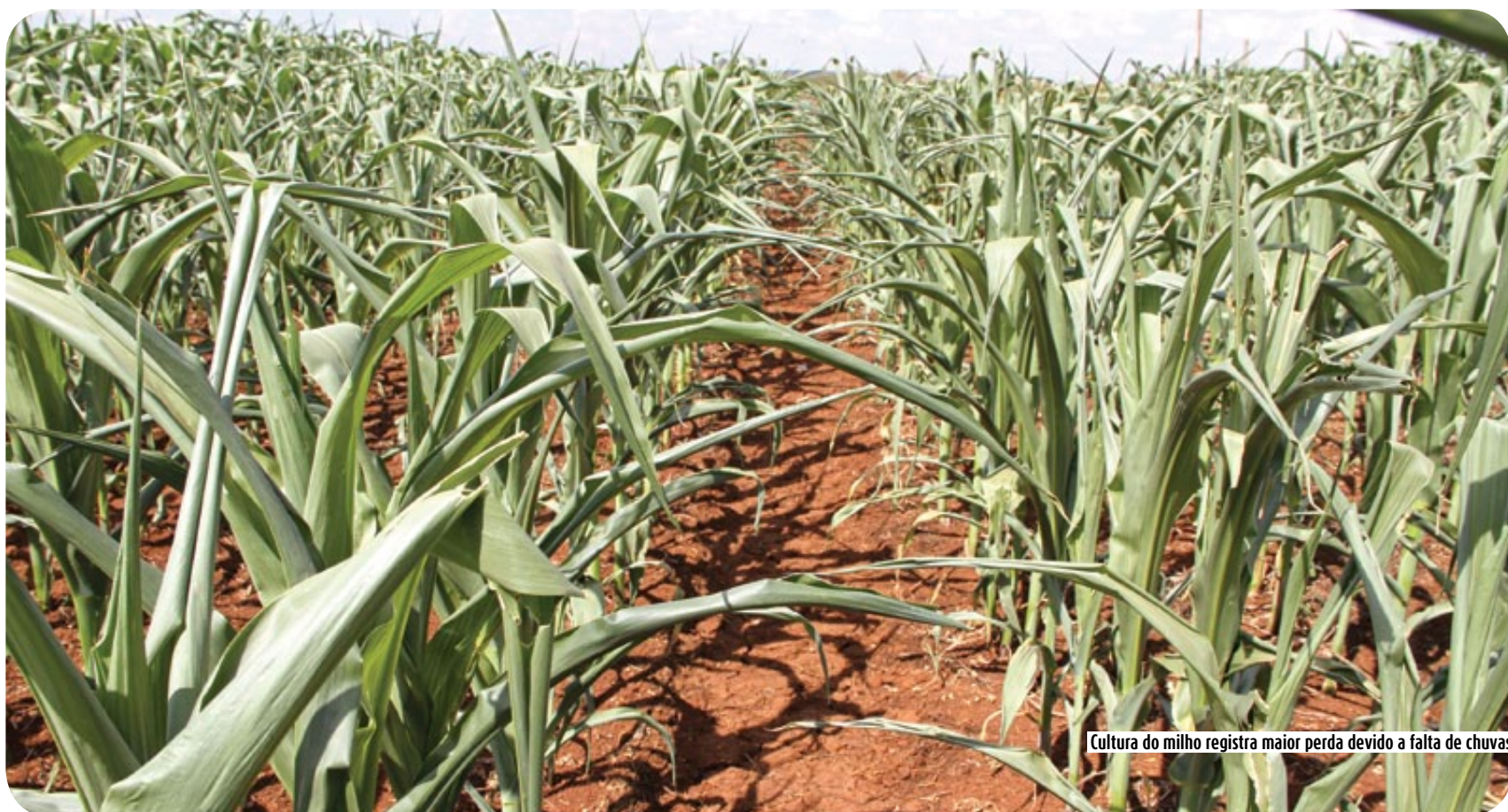
Cultura do milho registra maior perda devido a falta de chuvas

No mês de outubro, o município de Campos Novos contou com volumes mais significativos de chuva, com um total acumulado de 203,7mm, que corresponde a 83% da média histórica esperada para o mês, que é de 245,2mm. Já em novembro de 2012, o total mensal acumulado foi de 13,6mm, que corresponde a apenas 9% da média histórica esperada para o mês que é de 148,1mm.