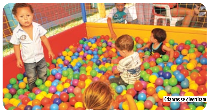
Crianças se divertiram