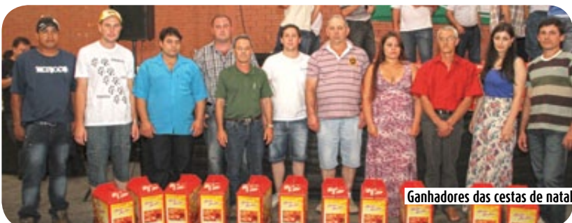
Ganhadores das cestas de natal