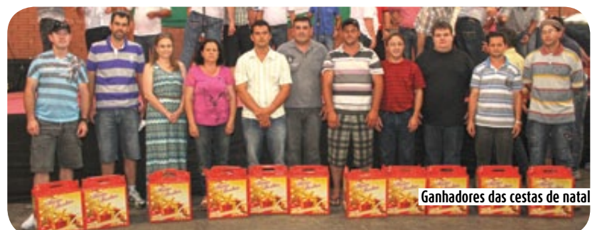
Ganhadores das cestas de natal