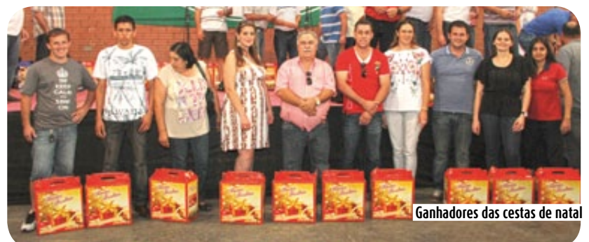
Ganhadores das cestas de natal