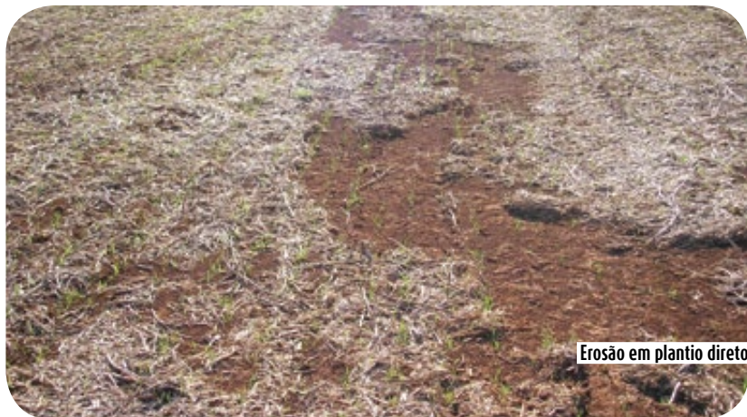
Erosão em plantio direto

Que o dia 5 de dezembro fique marcado como um dia de reflexão e que motive os pesquisadores, extensionistas, produtores rurais, governos federal, estaduais e municipais e, principalmente, a sociedade civil, a priorizar os cuidados com o uso e a qualidade do solo como um fator de sobrevivência do homem e das demais espécies na face da terra.