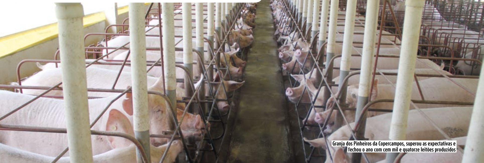
Granja dos Pinheiros da Copercampos, superou as expectativas e fechou o ano com cem mil e quatorze leitões produzidos

E m 2014 a produção de suínos na Granja dos Pinheiros da Copercampos, superou as expectativas e fechou o ano com cem mil e quatorze leitões produzidos, cerca de 12,6 mil a mais do que o projetado pelo Departamento Agroindustrial da cooperativa, que era 88,4 mil suínos. A granja produz linhagens para Agrocerec Pic, sendo cruzamentos que produzem 8 linhagens.