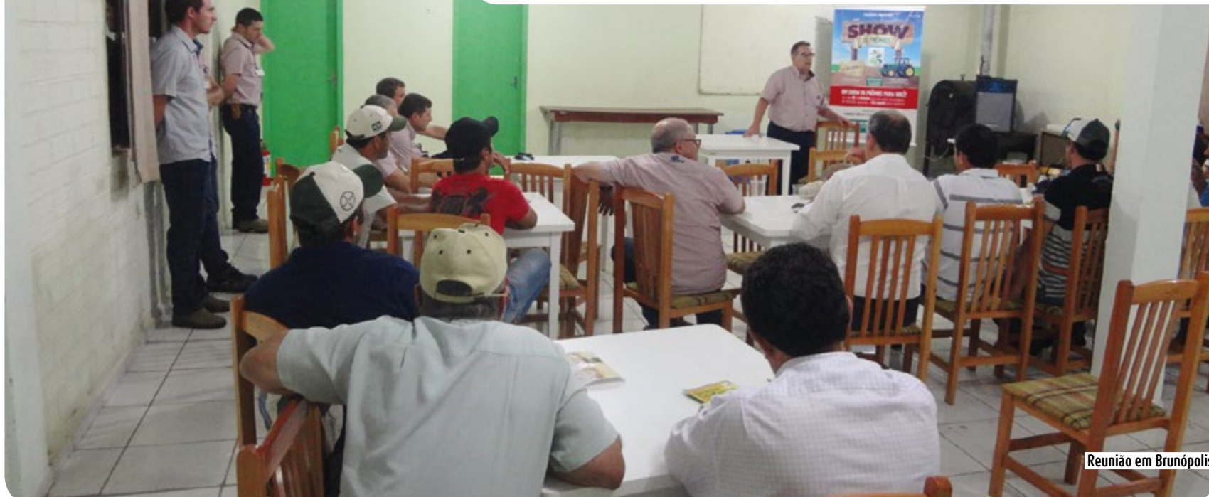
Reunião em Brunópolis

Com o objetivo de levar informações e esclarecer dúvidas relacionadas ao recebimento da safra 2014/2015 a Copercampos realizou duas importantes reuniões com os produtores e associados das unidades de Brunópolis e Linha Hervalzinho (RS).