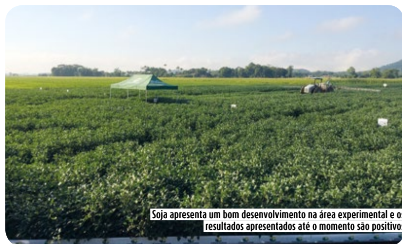
Soja apresenta um bom desenvolvimento na área experimental e os resultados apresentados até o momento são positivos

Já o Consultor Técnico e Engenheiro Agrônomo da Copercampos, Fabricio Jardim Hennigen, ressalta que a soja apresenta um bom desenvolvimento na área experimental e os resultados apresentados até o momento são positivos. “O trabalho está sendo positivo e demonstra que o investimento em áreas de várzea de arroz é viável. No entanto é preciso ajustar alguns detalhes relacionados ao processo de plantio e manejo da área a ser implantada a cultura da soja”, enfatiza Fabricio Jardim Hennigen.