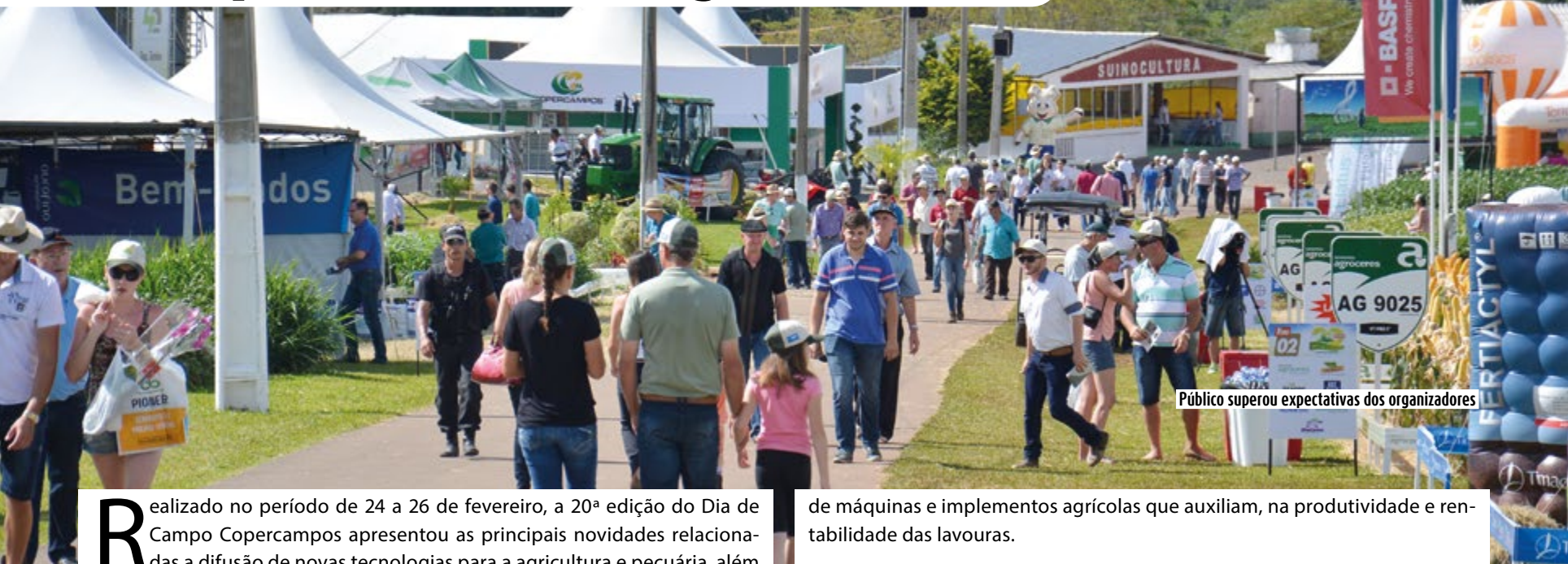
Público superou expectativas dos organizadores

Realizado no período de 24 a 26 de fevereiro, a 20ª edição do Dia de Campo Copercampos apresentou as principais novidades relacionadas a difusão de novas tecnologias para a agricultura e pecuária, além