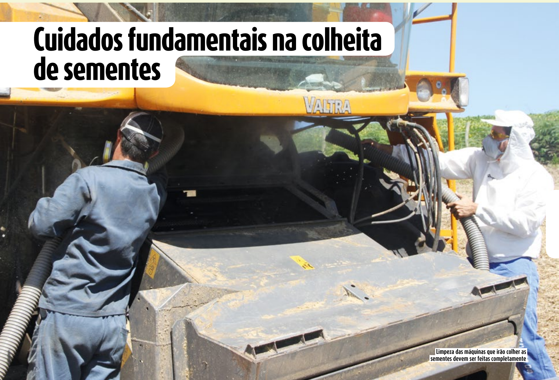
Limpeza das máquinas que irão colher as sementes devem ser feitas completamente

P ara se produzir sementes com o padrão Copercampos, muitos são os desafios durante a safra. Inspeções para que não exista mistura de variedades são realizadas, porém a limpeza das máquinas que irão colher as sementes devem ser feitas completamente.