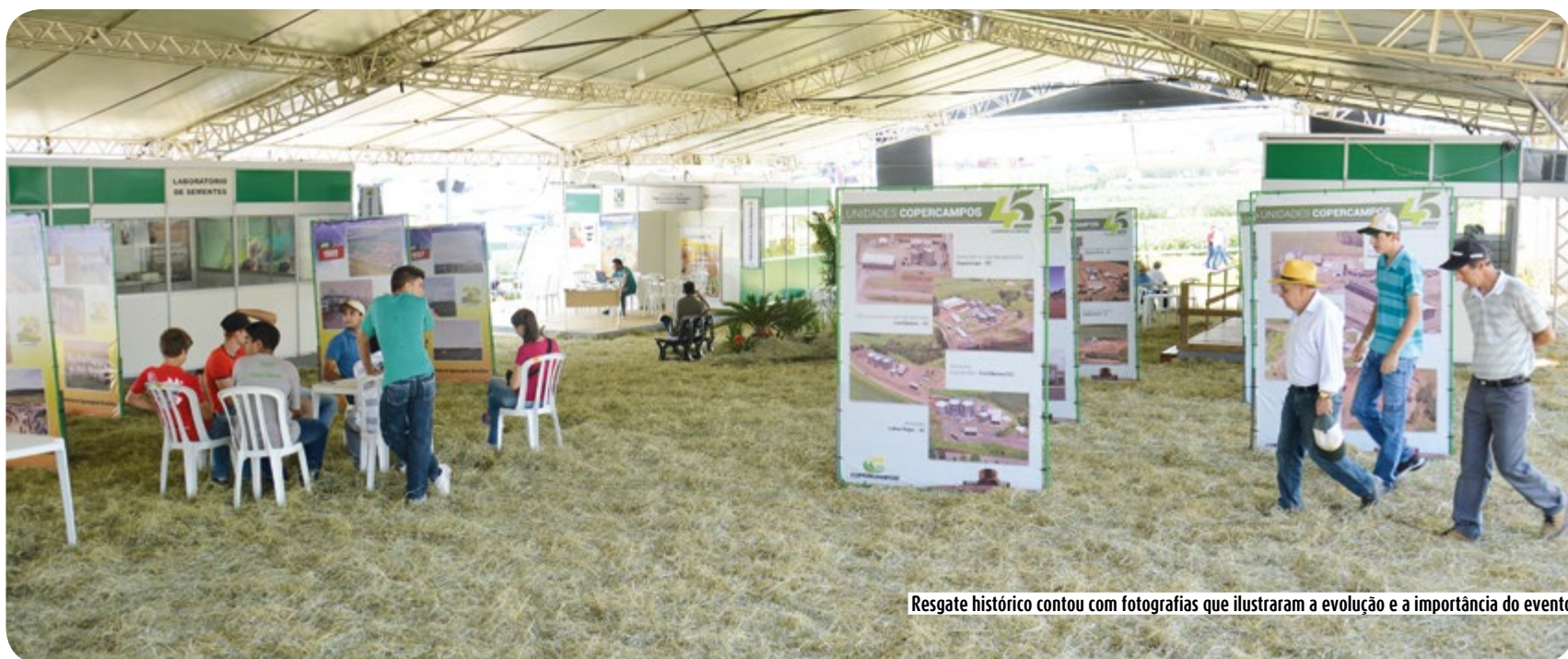
Resgate histórico contou com fotografias que ilustraram a evolução e a importância do evento

Mantendo sempre seu foco inicial e compromisso com a valorização do agricultor rural, o evento tornou-se referência no agronegócio brasileiro.