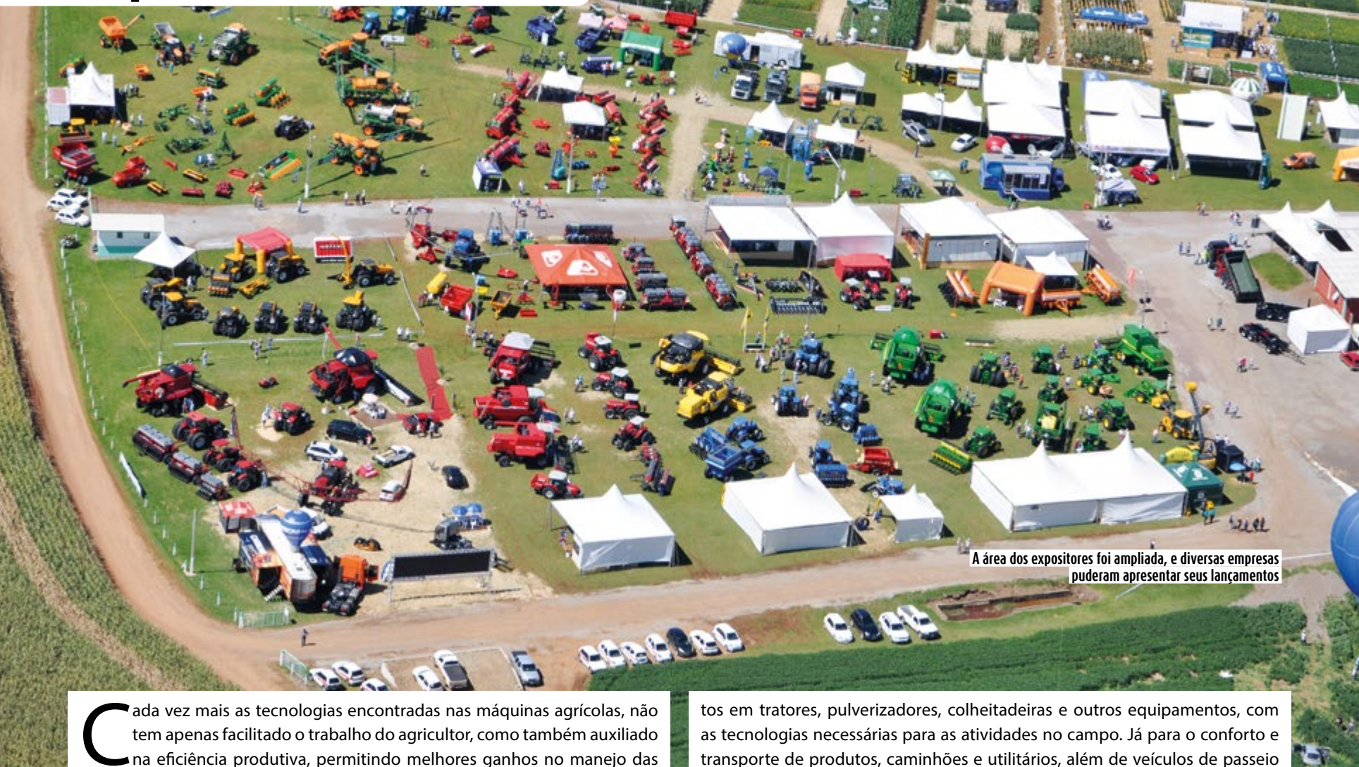
A área dos expositores foi ampliada, e diversas empresas puderam apresentar seus lançamentos

Cada vez mais as tecnologias encontradas nas máquinas agrícolas, não tem apenas facilitado o trabalho do agricultor, como também auxiliado na eficiência produtiva, permitindo melhores ganhos no manejo das culturas. E para atender as necessidades dos produtores, a área dos expositores foi ampliada, e diversas empresas puderam apresentar seus lançamen-