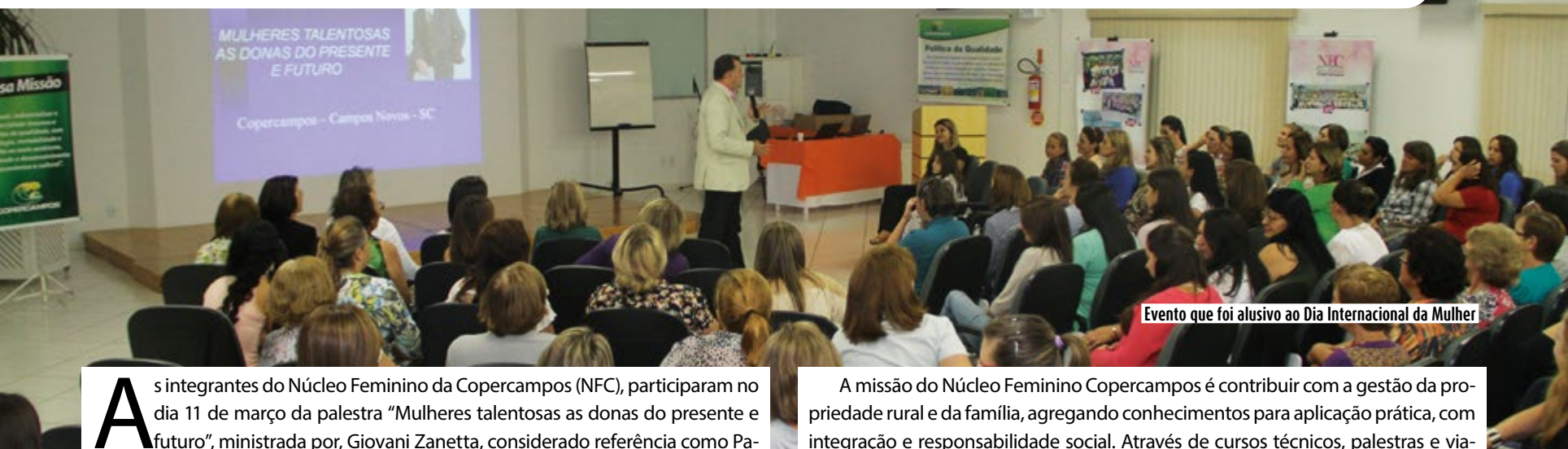
Evento que foi alusivo ao Dia Internacional da Mulher