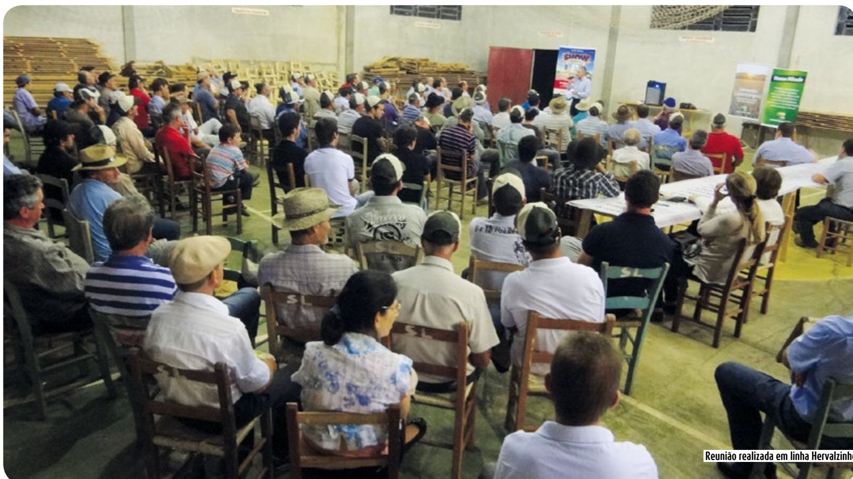
Reunião realizada em linha Hervalzinho