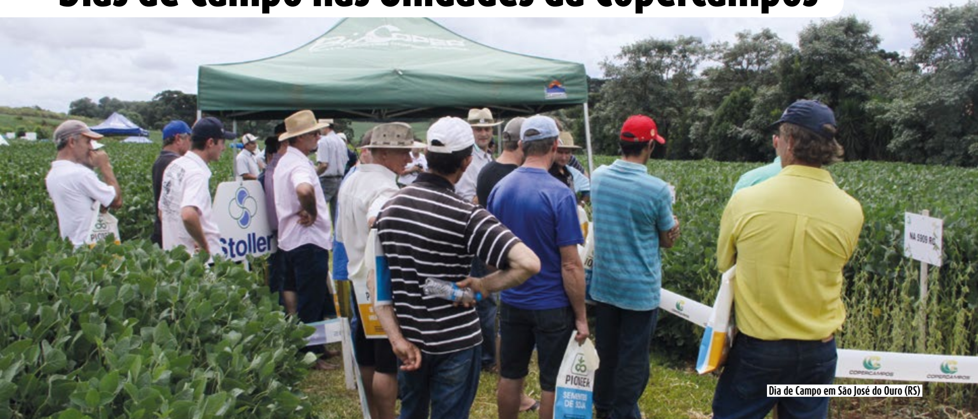
Dia de Campo em São José do Ouro (RS)

No dia 19 de fevereiro a filial de São José do Ouro realizou uma tarde de campo, onde tecnologias foram apresentadas para as culturas da soja. Já no dia 11 de março, a Copercampos realizou o Dia de Campo no Campo Experimental da unidade do município de Zortéa.