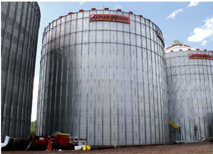
Armazém 09 localizado na Matriz em Campos Novos

Já o município de Zortéa passou a contar com uma ampla e moderna loja agropecuária. "Podemos destacar que a nova Loja Agropecuária conta com uma estrutura muito moderna, funcional, onde teremos estocagem de produtos. Além de oferecer ao produtor rural uma variedade em itens para auxiliá-los em suas atividades do dia a dia", resalta Marcos Fiori.