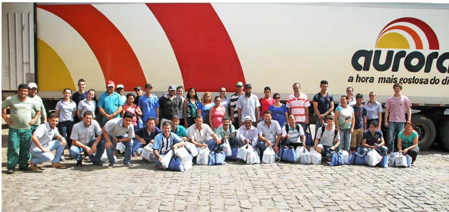
Cada funcionário recebeu um Kit Ceia Feliz da Aurora

A entrega dos kits foi coordenada pelo setor de Gestão de Pessoas.