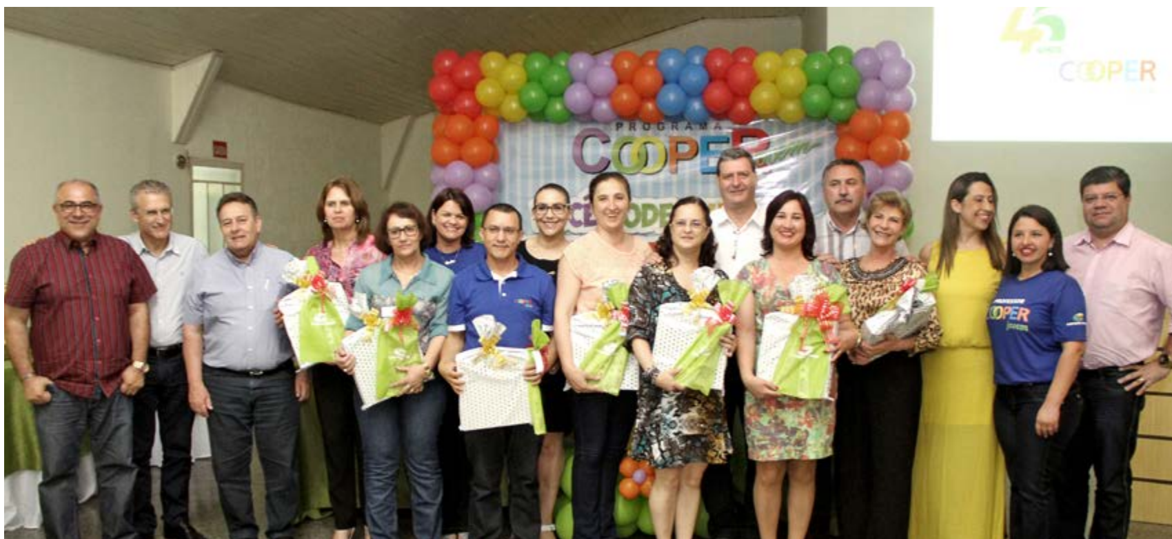
Encerramento foi realizado no dia 09 de dezembro

Como forma de reconhecimento aos alunos e professores que se destacaram no Programa Cooperjovem no ano de 2015 e agradecer ao município de Campos Novos através da secretaria de educação, a Copercampos realizou no dia 09 de dezembro a solenidade de encerramento das atividades do Programa Cooperjovem deste ano e a premiação aos participantes do 4º Concurso Estadual de Desenho e 9º Prêmio de Redação.