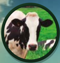
BOVINOS DE LEITE