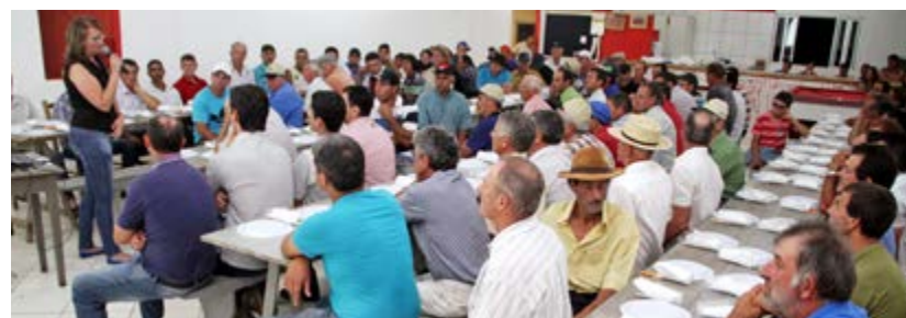
Evento reuniu cerca de 150 pessoas no Clube Internacional.

lorização dos produtores, pois temos espaço dedicado a uma conversa e a proporcionar aos produtores informações e novidades do mercado de fertilizantes e de sementes”, destacou Chú