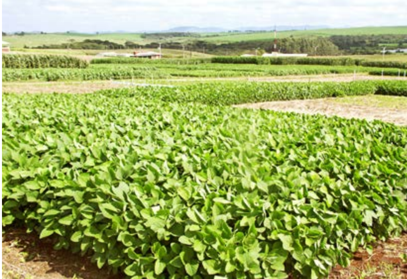
Vitrines das culturas da safra de verão 2015/2016

Os resultados dos testes com sementes, produtos químicos e técnicas de produção, nas culturas de feijão, milho, soja e pastagens, servem de referência para o planejamento das áreas de produção dos associados da Copercampos e agropecuaristas visitantes.