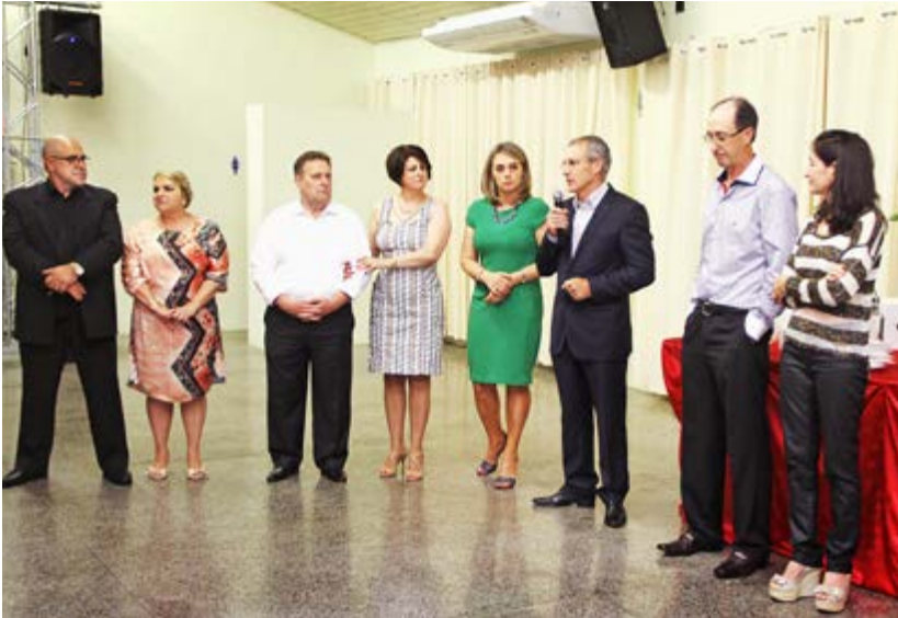
Evento foi realizado dia 16 de dezembro na AACC

Após o jantar, de maneira descontraída o Diretor Presidente e o Vice-presidente, entregaram brindes aos convidados do evento.