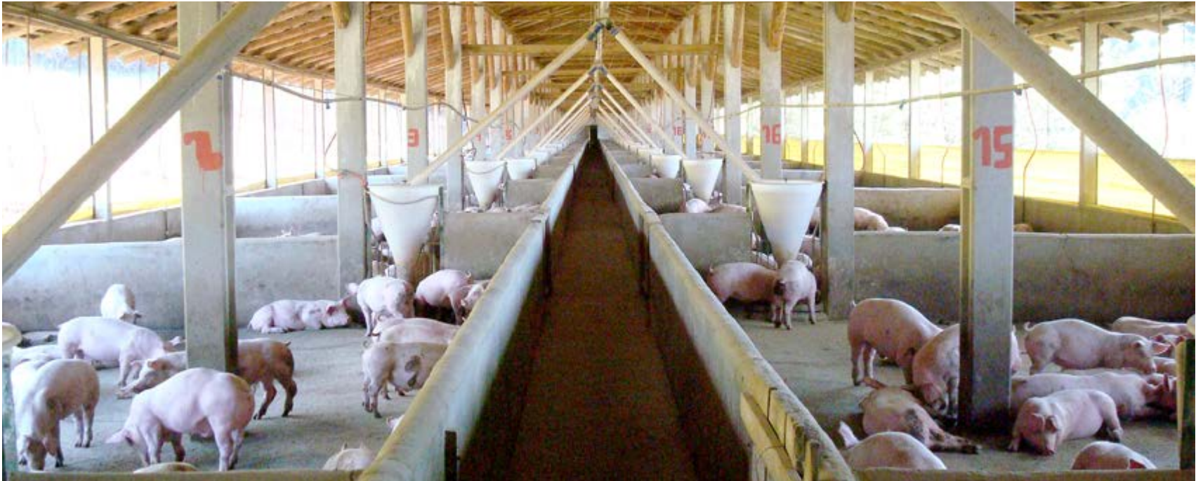
Os suínos devem estar com o melhor conforto para um maior desempenho e uma maior rentabilidade

Nos meses mais quentes do ano o manejo dos suínos é um fator muito importante devido as condições ambientais que devem ser administradas com muito cuidado, sendo fundamental para a otimização do desempenho na fase de crescimento. Temperatura e umidade ideais promovem o conforto dos suínos dentro das baias, estimulam o consumo de ração, evitam o gasto de energia excessiva para manter a temperatura corporal e minimizam o impacto de doenças.