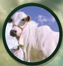
BOVINOS DE CORTE

A ventilação de instalações é um ponto relevante para as fases de crescimento e terminação, mas é preciso ter cuidado para evitar o excesso, pois os suínos demonstram desconforto em dias de muito vento.