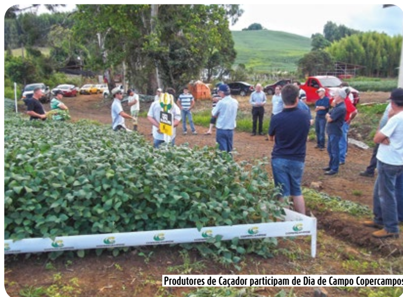
Produtores de Caçador participam de Dia de Campo Copercampos