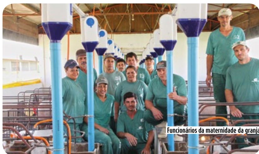
Funcionários da maternidade da granja