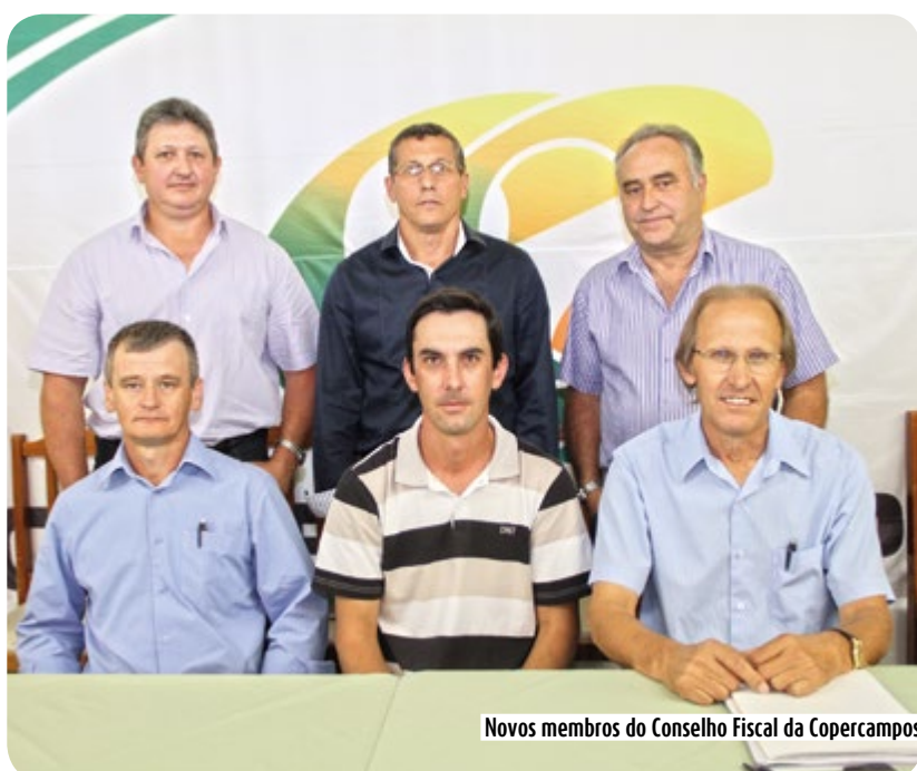
Novos membros do Conselho Fiscal da Copercampos