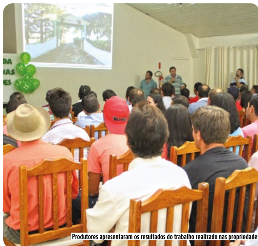
Produtores apresentaram os resultados do trabalho realizado nas propriedades