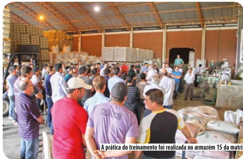
A prática do treinamento foi realizada no armazém 15 da matriz

mentes, sendo assim, é necessário que o sistema operacional nas unidades estejam ajustados e adequados, reduzindo os prejuízos nestas etapas." Villella enfatizou ainda que Campos Novos e região possuem condições favoráveis a produção de semente, por possuírem clima seco e frio durante o período de armazenagem o que favorece a qualidade da semente.