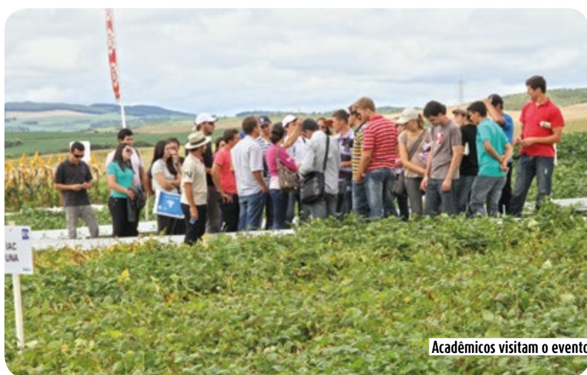
Acadêmicos visitam o evento

A produção de soja também foi um dos assuntos que mereceu destaque nesta edição. Sendo uma das principais atividades da cooperativa, este ano as vitrines de soja trouxeram cultivares com novas tecnologias, como é o caso da INTACTA RR2 PRO, e os produtores puderam conferir e tirar suas dúvidas sobre a genética e manejo destes materiais. Destaque também para as atividades desenvolvidas pelas Instituições de pesquisa.