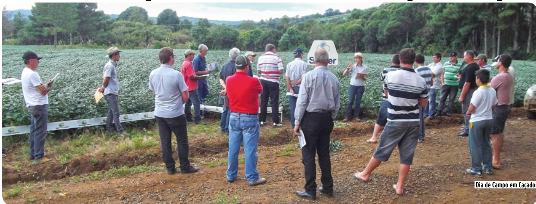
Dia de Campo em Caçador

Iniciaram os Dias de Campo nas Unidades da Copercampos. No dia 07 de março a filial de Zortéa e produtores de Lebon Régis e Caçador, realizaram uma tarde de campo, onde tecnologias foram apresentadas para as culturas da soja.