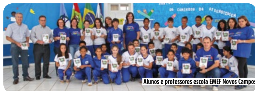
Alunos e professores escola EMEF Novos Campos