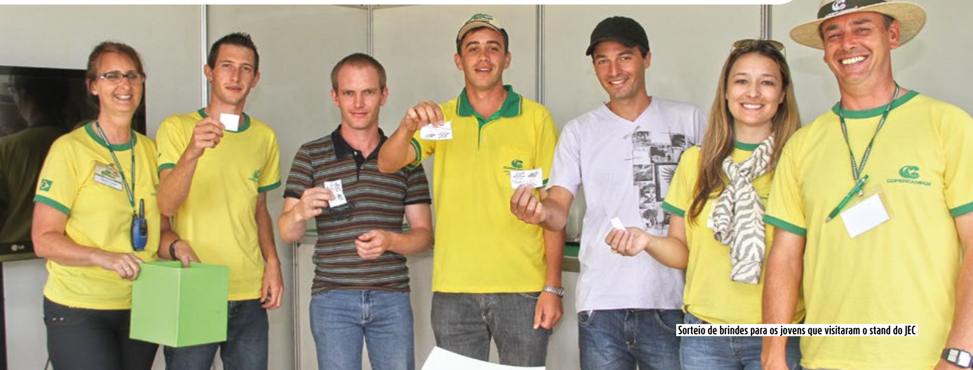
Sorteio de brindes para os jovens que visitaram o stand do JEC

O Programa da Copercampos destinado aos jovens, filhos de associados da cooperativa denominado Jovens Empreendedores Copercampos – JEC, esteve mais uma vez presente no Dia de Campo. No stand, integrantes do grupo apresentaram aos visitantes um pouco do trabalho já realizado pelo grupo e também aproveitaram a oportunidade para convidar jovens a ingressar no projeto.