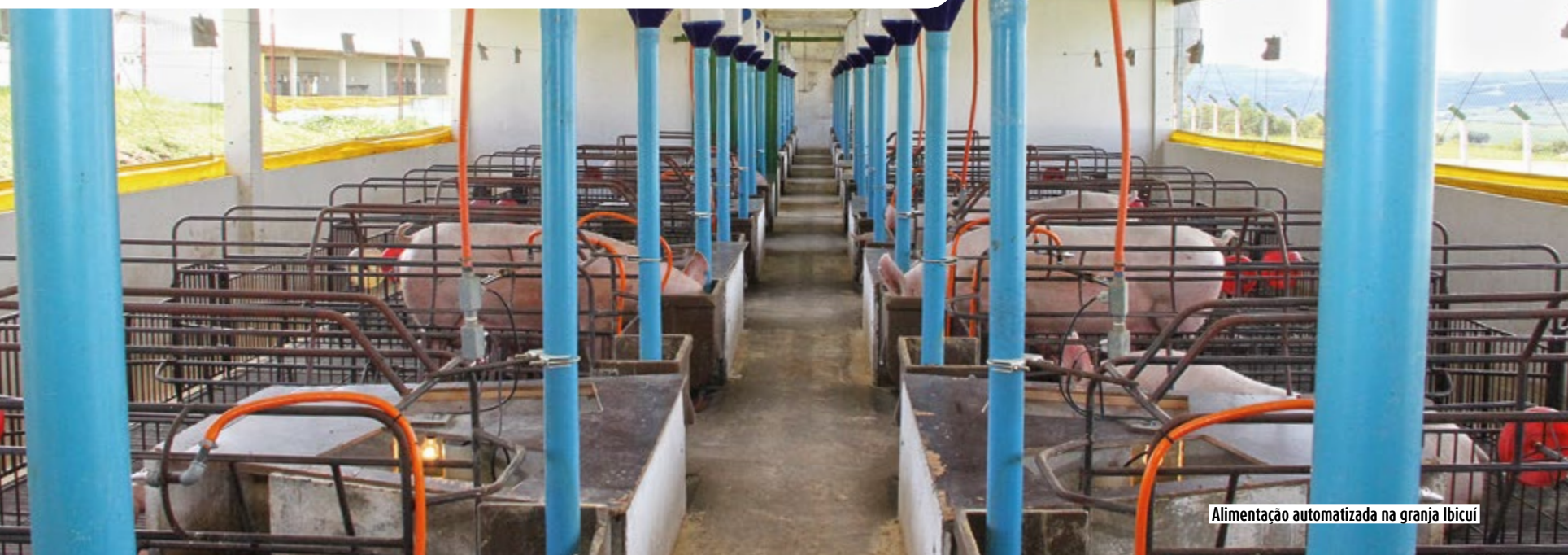
Alimentação automatizada na granja Ibicuí

Sistema garante dosagem correta de ração e benefícios na alimentação suína