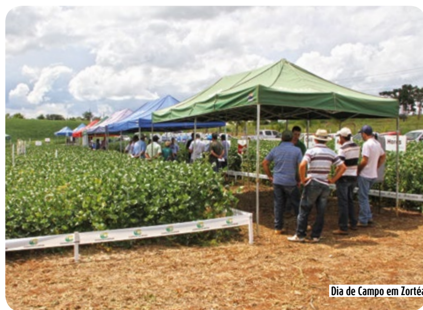
Dia de Campo em Zortéa