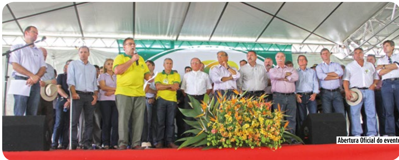
Abertura Oficial do evento

Mas para que toda essa cadeia continue a produzir, é extremamente necessário à agricultura, e por isso que com a presença de autoridades no evento destaque alguns assuntos muitas vezes comentados pelos produtores, porém pouco discutidos pelas autoridades. O PIB (Produto Interno Bruto) no setor agrícola no ano de 2013, foi de 7,45% e o saldo comercial do agronegócio fechou R$ 40 bilhões. Mesmo com todo este resultado positivo, é muito difícil, nós agricultores obtermos uma conversa com as autoridades do governo federal e estadual para discutirmos as melhorias à agricultura. É por isso que em nome de todos os produtores agrícolas da região, peço as autoridades que se comprometam com o setor agrícola, e invistam em infraestrutura, valorizando esta atividade que tanto faz crescer o nosso país. Finalizou Chiocca. O Vice-governador, Eduardo Pinho Moreira, parabenizou a Copercampos pela grandiosidade do evento, e garantiu que a reivindicação será entregue ao Governador do Estado. Eduardo Pinho Moreira, destacou também que a agricultura precisa ser melhor valorizada, e é através de eventos como este que os produtores se mantem organizados e buscando informações para garantir seus direitos e melhorias na agricultura.