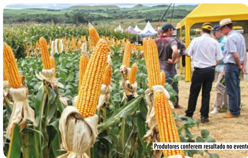
Produtores conferem resultado no evento