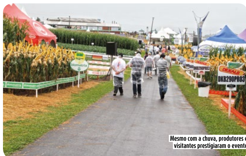
Mesmo com a chuva, produtores e visitantes prestigiaram o evento