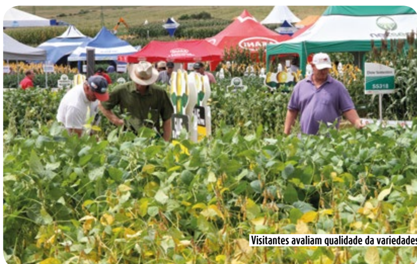
Visitantes avaliam qualidade da variedades