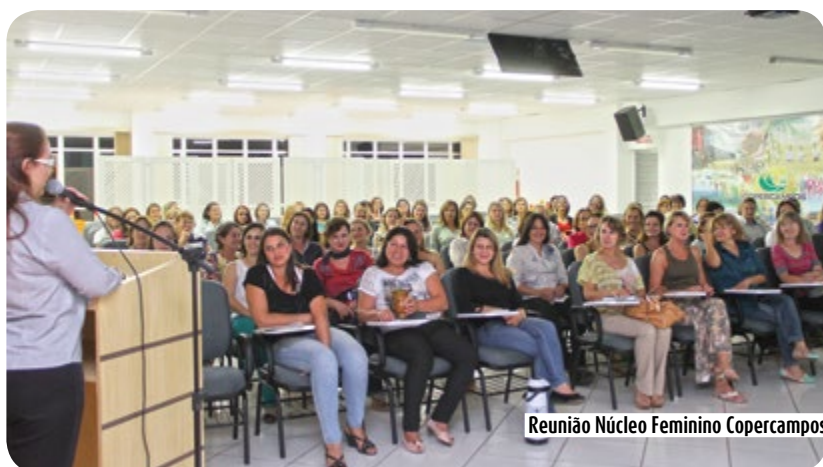
Reunião Núcleo Feminino Copercampos