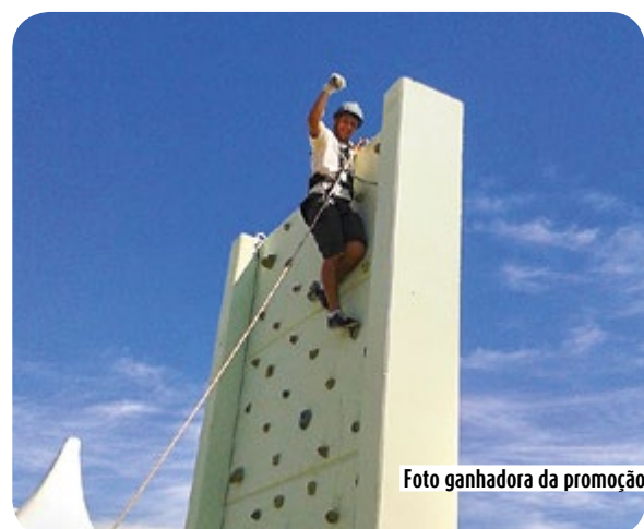
Foto ganhadora da promoção