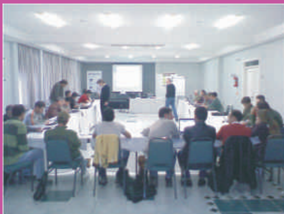
Curso realizado em Campos Novos

pela Federação da Agricultura e Pecuária do Estado de Santa Catarina e a Confederação da Agricultura e Pecuária do Brasil, com apoio do Sindicato dos Produtores Rurais de Campos Novos. Estiveram presentes produtores rurais de Caçador, Lebon Regis, São José Cerrito, Florianópolis, Água Doce, Mafra, Campo Belo do Sul e Campos Novos.