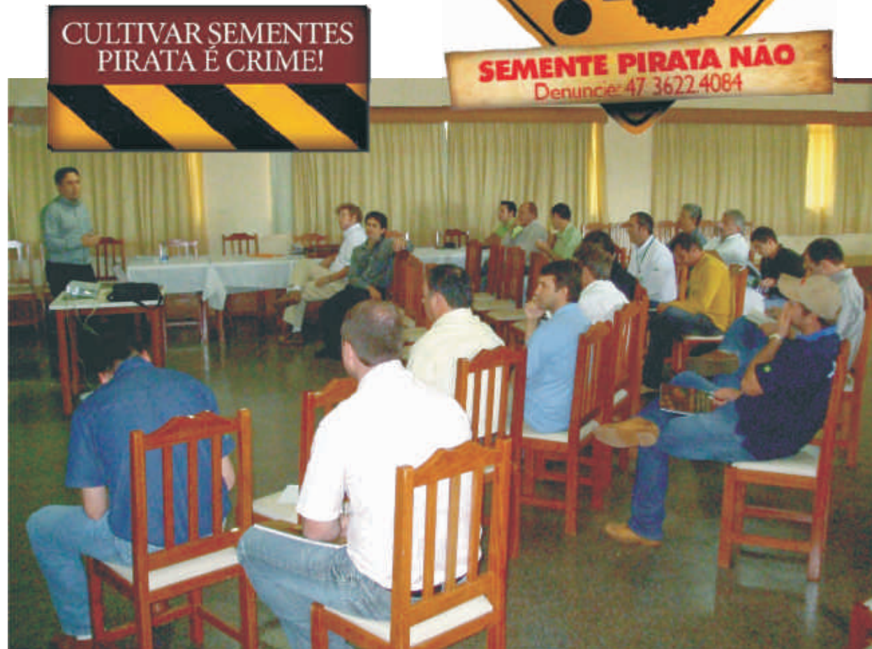
Reunião com representantes de empresas

início da fiscalização em pontos estratégicos. “Além das informações repassadas aos fiscais da Cidasc, vamos contratar um secretário executivo para a associação”, reitera. A divulgação visual contra a pirataria será realizada através de outdoors, placas rodoviárias, jornais, revistas, panfletos e display de balcão.