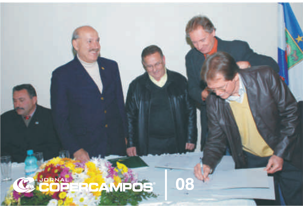
Associados e convidados participaram do evento