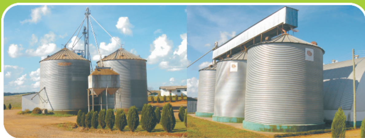
Unidade 48 – Armazenadora (Silos)

Nas unidades 36 e 48, atuam sete funcionários.