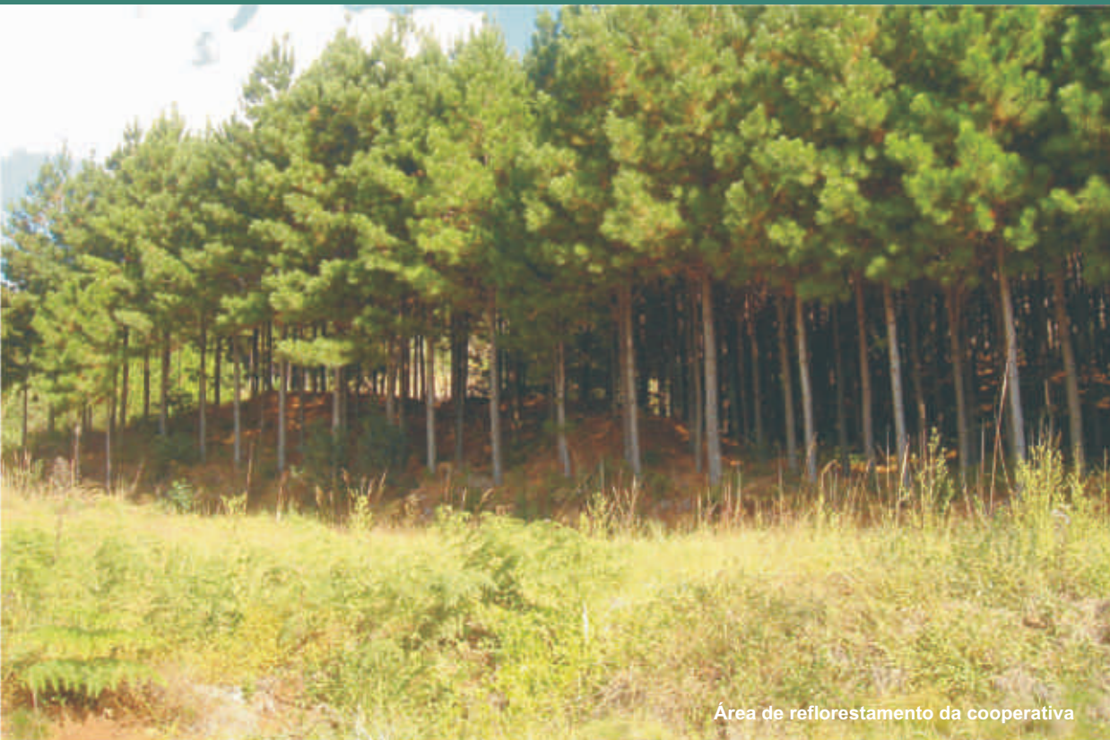
Área de reflorestamento da cooperativa

Outro projeto indispensável é o plantio de árvores para o reflorestamento. Além de ser economicamente viável, o meio ambiente agradece. As espécies mais plantadas na região: “Pinus sp. e o Eucalyptus sp.”.