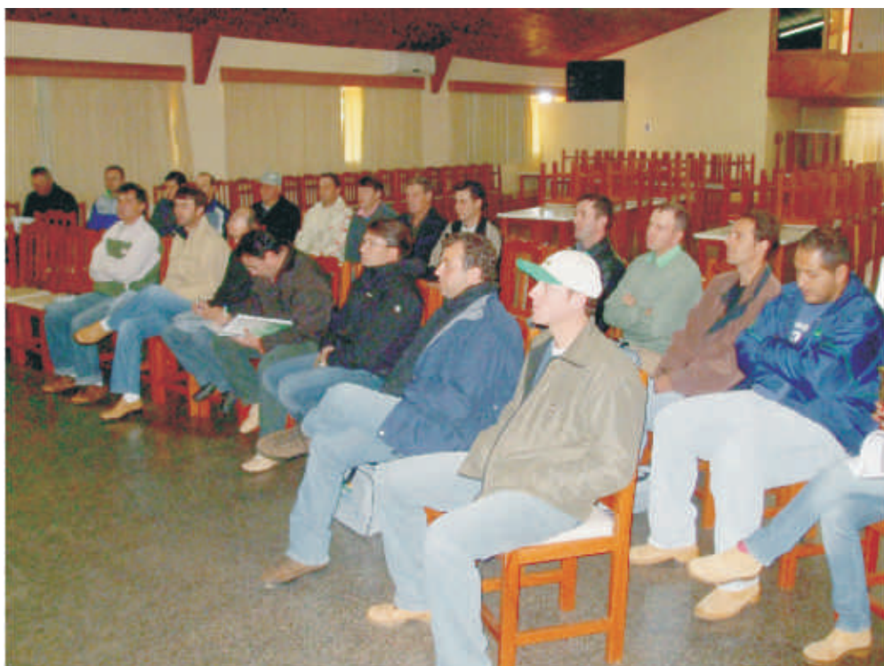
Produtores associados e Engenheiros Agrônomos da Copercampos

Campos Novos: “Quero aplicar as técnicas que aprendi aqui em minha propriedade. Se o agricultor não ficar atento, terá dificuldades. O mercado está dinâmico”.