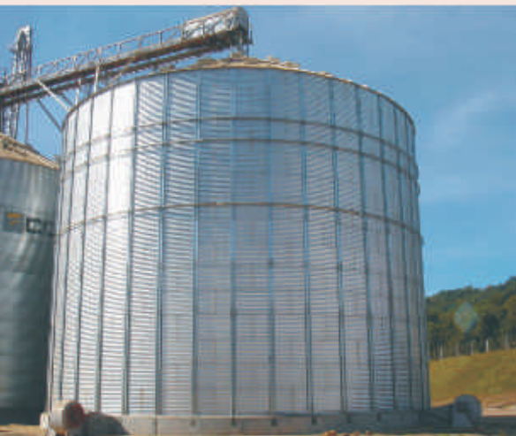
Novo silo para armazenagem

Construção de um silo de três toneladas para estocagem de milho. A capacidade de armazenagem da unidade passou de 6,6 ton. para 9,6 ton. de produtos a granel. O investimento na aquisição do silo e instalações foi de R$ 400 mil. Ainda na filial de Brunópolis, a área operacional foi contemplada com a compra de um “tombador” para descarga de caminhões no valor de R$ 90 mil.