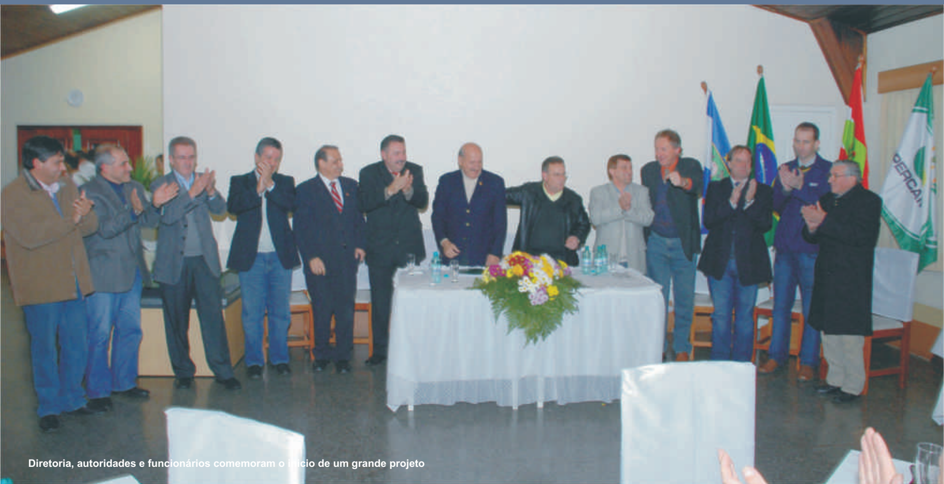
Diretoria, autoridades e funcionários comemoram o início de um grande projeto

Um importante passo foi firmado com a assinatura do Contrato de Financiamento do Projeto de Industrialização de Carne Suína (Frigorífico Copercampos). A solenidade de assinatura com o BRDE - Banco Regional de Desenvolvimento do Extremo Sul, aconteceu no dia 3 de junho, na Associação Atlética Copercampos. O Governador do Estado de Santa Catarina, Luiz Henrique da Silveira e o Diretor Financeiro do BRDE, Renato Viana, prestigiaram o evento.