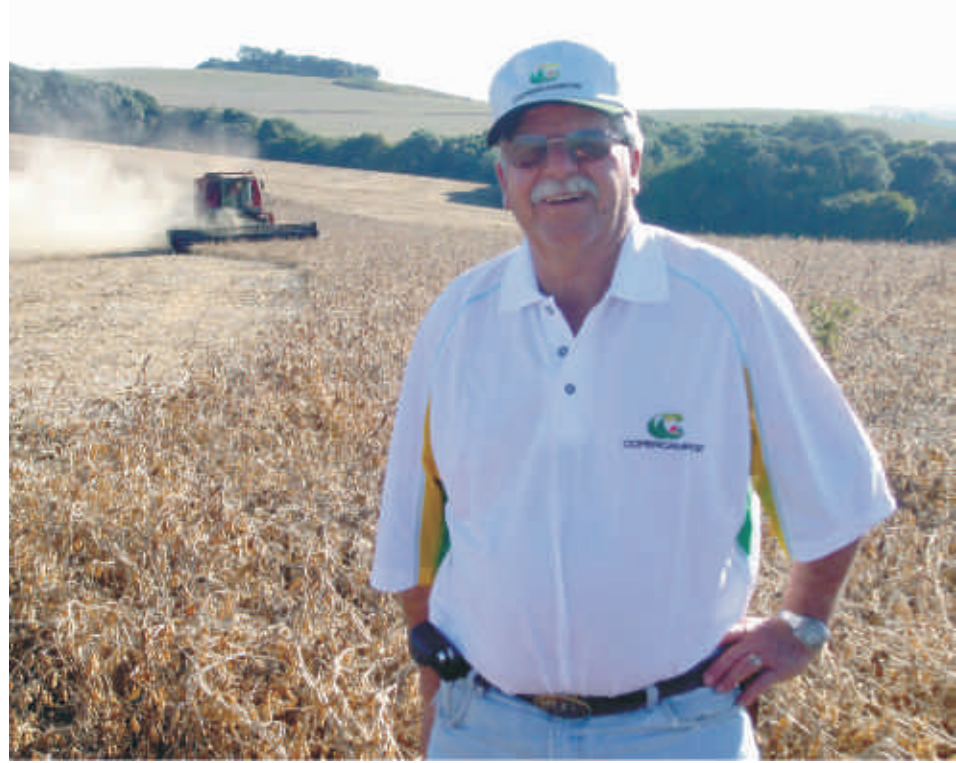
Colheita na lavoura de soja