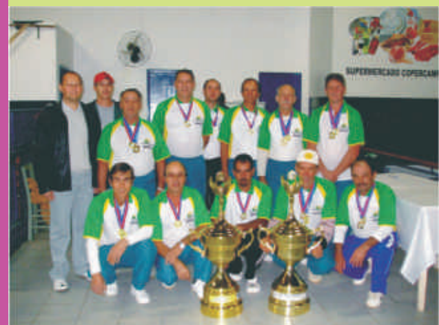
Mais uma vitória no esporte amador

Após vitória na cancha do adversário (Mantovani) e resultado de 1 x 0 em casa, a equipe de Bocha da AACC Copercampos foi a campeã no Campeonato Municipal de Bocha. A final aconteceu na noite do dia 29/05.