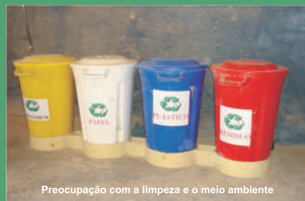
Preocupação com a limpeza e o meio ambiente

Na Indústria de Rações, o lixo produzido também é separado. São quatro lixeiras: papel, resíduo de ração, metal e madeira. O procedimento faz parte do Programa de Boas Práticas, desenvolvido a cada 45 dias no setor.