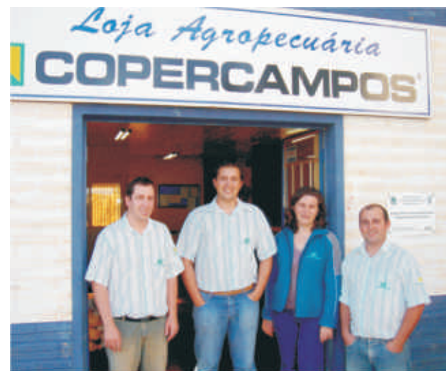
Funcionários da cooperativa em Barracão

No ano passado, o faturamento das unidades representou 10% dos R$ 330 milhões de movimentação gerados pela Copercampos. “O crescimento dos negócios foi fundamental na expansão da cooperativa”, declara o Chefe de Unidade. Em arrecadação de ICMS (movimentação econômica) em Barracão, a Copercampos ocupa o 2º lugar com a filial 48, e 3º lugar com a unidade 36.