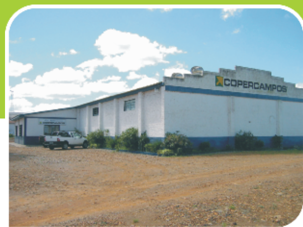
Unidade 36 – Loja Agropecuária