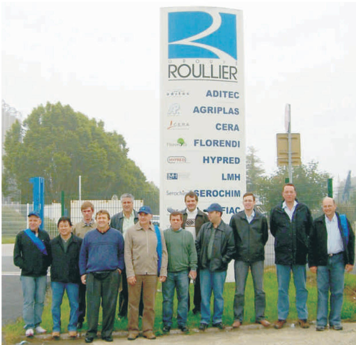
Grupo em frente a sede da empresa na França

A Copercampos também preocupada com as dificuldades enfrentadas pelos agricultores, realiza estudos através da Gerência de Insumos. O objetivo é avançar nas pesquisas e desenvolver alternativas para o agronegócio. O projeto da unidade de industrialização de fertilizantes está na fase final e deverá ser implantada nos próximos meses.