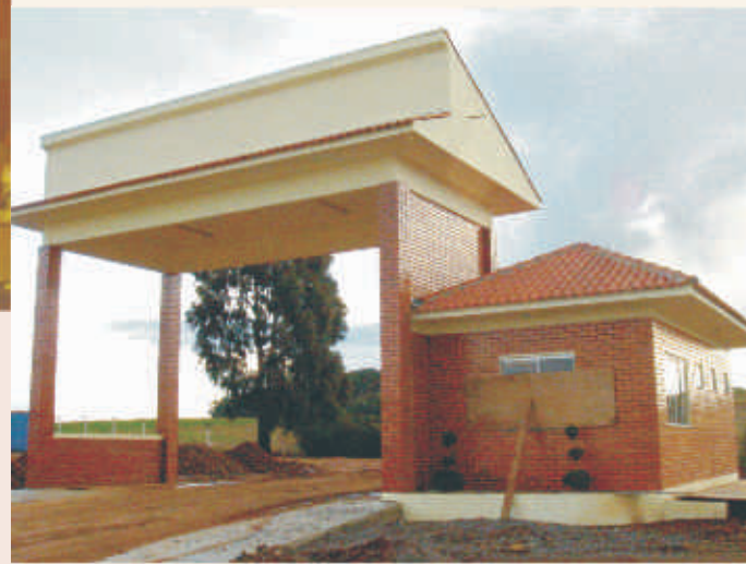
Mais infra-estrutura para o motorista

A Copercampos está investindo em uma nova guarita de controle para o acesso de caminhões. Com total infra-estrutura (banheiros e chuveiros) a melhoria beneficiará diretamente os motoristas terceirizados. O investimento é de R$ 50 mil.