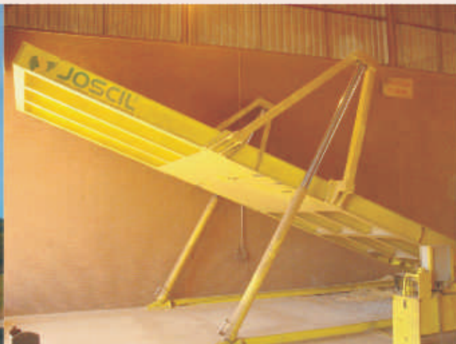
Tombador para descarga da produção